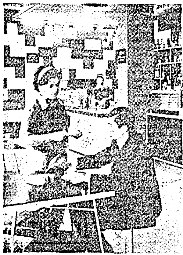
După-masă la colectăria „Delicia”.