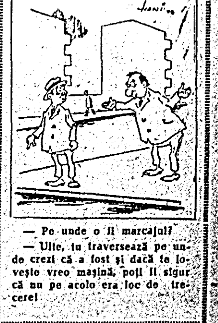
— Po unde o fi marcajul? — Uite, tu traversează pe unde crezi că a fost și dacă te lovește vreo mașină, poți fi sigur că nu pe acolo era loc de trecere!

Dungile albe care marceau locuri de trecere pentru pietoni s-au șters de mult de pe străzile orașului nostru, iar în așteptarea unei zăpezii care rețuza să cadă și să pună „alb” peste tot, gospodarii orașului nu le-au mai făcut.