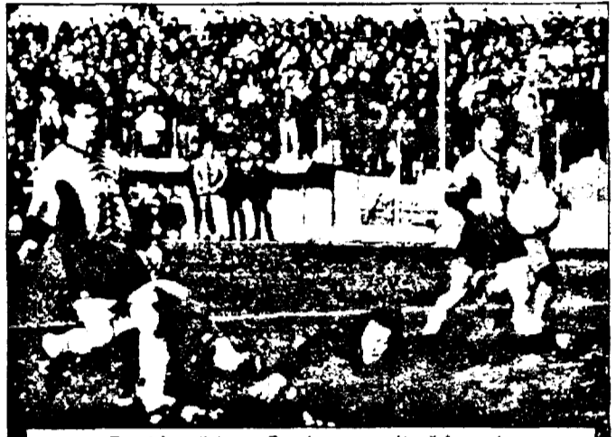
Deși în cădere, Panin a reușit să înscrie.

partea antrenorului Costică Ștefănescu, acesta intrând până la mijlocul terenului, pentru a-și spune păsul. Ologeanu a ezitat să ia vreo decizie decisivă, iar în repriza secundă o minge șutată intenționat de Rohat i-a trecut pe lângă ureche „centralului”, fără ca acesta să-l dea afară din joc pe fundașul oaspete. Practic, a fost fotbal foarte puțin, însă nervi cu nemiluita. LEO SFĂRA