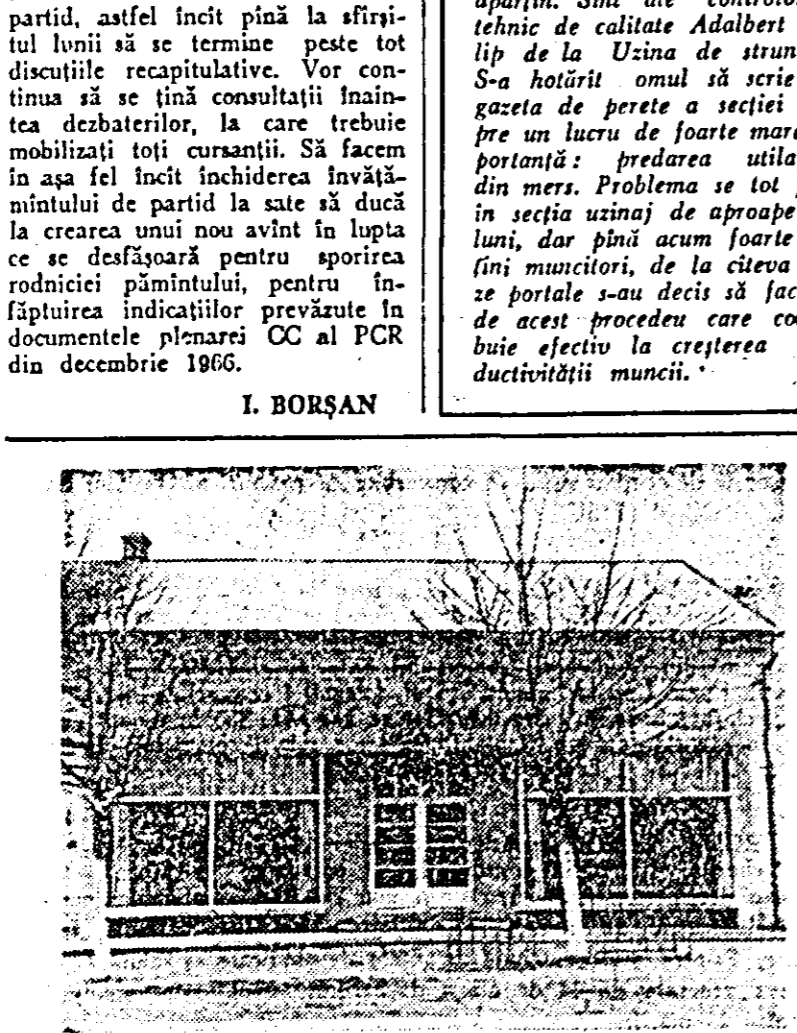
Aspect exterior al magazinului alimentar cu autoservire din comuna Pecica.

La fabrica de produse chimice „Sinteză” din Oradea a început fabricarea pe scară industrială a unui nou produs numit Cimexan. Obținut în laboratoarele fabricii și trecînd cu succes experimentările, Cimexanul este un valoros insecticid, cu utilizare în dezinfecția locurilor și localurilor aglomerate (vagoane, spații casnice, localuri). Deși se realizează la un preț de cost mai scăzut decît alte produse de acest fel, prin efectele sale se dovedește superior acestora. În plus, noul insecticid — realizat sub formă de lichid — este odorizat, lășînd un miros plăcut.