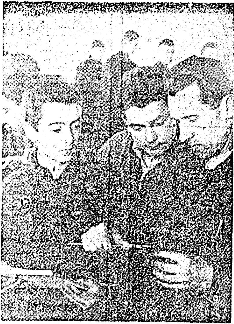
Viiitorii mecanizatori învață nu numai să conducă tractorul sau să folosească utilajele agricole ci și să repare mașinile pe care le au în dotare. Pentru aceasta orelor de lăcătușerie practică li se acordă toată atenția.

Vacanța de primăvară din acest an oferă nenumărate posibilități pentru distracție și drumeție, pentru desfășurarea unei munci culturale-artistice și sportive de înaltă calitate. Se cere doar din partea fiecărui membru al corpului didactic o muncă entuziastă și creatoare, menită să ofere copiilor și tineretului școlar o vacanță cât mai frumoasă, plină de întârire a dragostei lor pentru patrie.