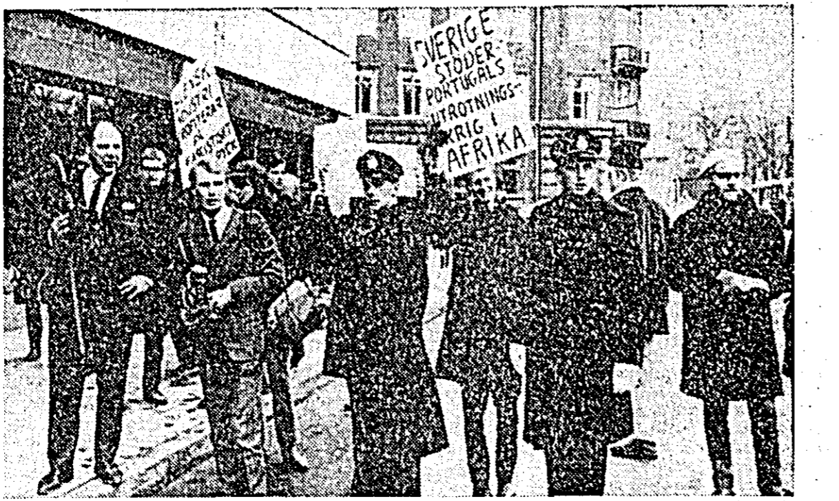
La Stockholm a avut loc o demonstrație de protest împotriva sprijinului economic acordat Portugaliei de către Suedia. ÎN FOTOGRAFIE: Aspect din timpul demonstrației.

lor Tokio, Hokkaido și Fukuoka rețin în mod deosebit atenția servatorilor politici. Conferința de la Tokio prezintă un interes aparte, deoarece postul de guvernator al capitalei japoneze are deosebită importanță „pentru stabilitatea guvernului premier Sato”, subliniază agenția Kyotun.