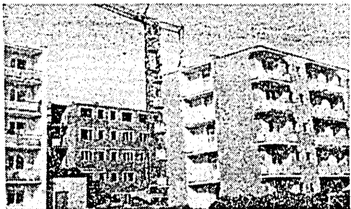
Noul blocul în construcție în zona Micălaca sud.

României la tenis de masă • Mica publicitate • Adunări generale ale oamenilor muncii • Actualitatea internațională