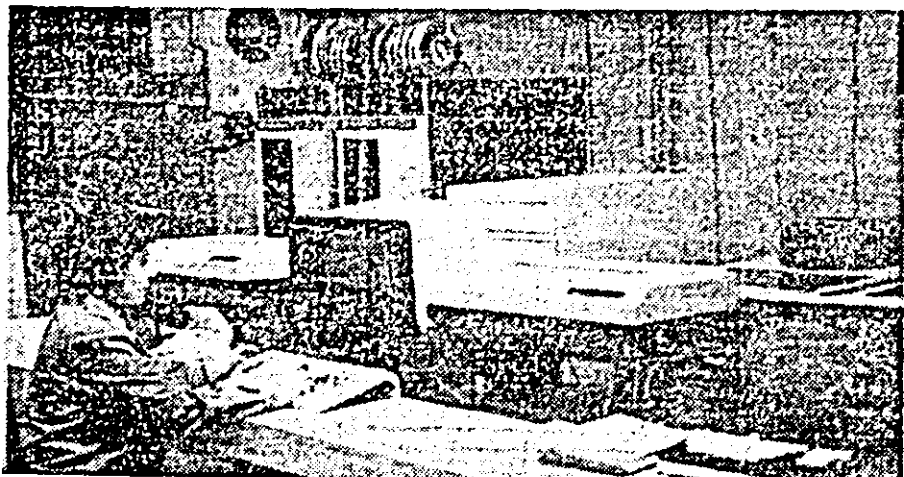
Aspect din activitatea oficiului de calcul electronic al întreprinderii de orologerie Industriale Arad.