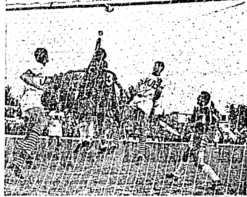
Fază din meciul Vagonul — Jiul

N.R. La începutul jocului, un număr de 25 de copii, îmbrăcați în echipament sportiv, au împărțit buchete de flori la cei 22 de jucători și la conducătorii partidei. Acesta la rândul lor au împărțit florile la public. A fost un moment plăcut pe care îl consemnăm cu plăcere.