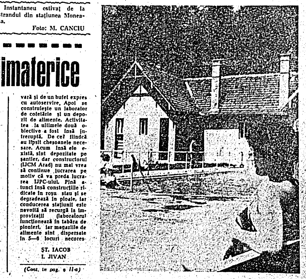
Instantaneu estival de la strandul din stațiunea Moneasa.

În onoarea tovarășului Nicolae Ceaușescu și a soției sale, Elena Ceaușescu, a membrilor delegației de partid și guvernamentale române, la Teatrul Mare din Phenian, a avut loc, joi seara, un spectacol de gală. Apariția în loja oficială a tovarășilor Nicolae Ceaușescu și Kim Ir Sen și a soțiilor lor, a membrilor conducerii de partid și de stat a celor două țări a fost întâmpinată cu vii și îndelungi aplauze. Se întonează imnurile de stat ale Republicii Socialiste Românie și Republicii Populare Democratice Coreene. 3.000 de artiști profesioniști și amatori au prezentat apoi, timp de două ore, epopea muzicală și coregrafică „patria noastră glorioasă”, înmănușind cîntec populare și revoluționare interpretate de coruri și orchestre executate, dansuri tradiționale cu eșarfe, mari montări coregrafice. Spectacolul a redat într-o interpretare impresionantă, de o înaltă ținută artistică, imagini din lupta pentru eliberarea socială. (Cont. în pag. a II-a)