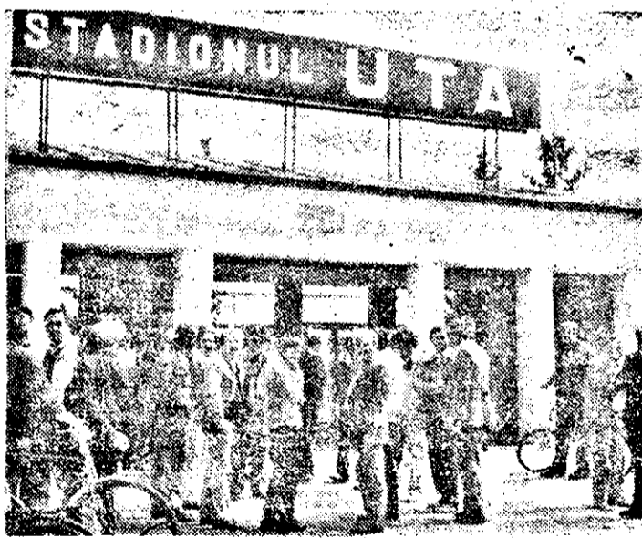
Duminică, dimineața, la stadionul UTA s-au adunat sute de suporteri (imaginea este surprinsă în timpul pauzei) care au urmărit meciul UTA — C.S.M. Reșița la... vă, clubul putea să organizeze o excursie la Ineu. Poate la meciurile viitoare!

AFL-CIO cere, de asemenea, ca în Congres să se ia decizia de acordare pentru Lituania a clauzei națiunii celei mai favorizate.