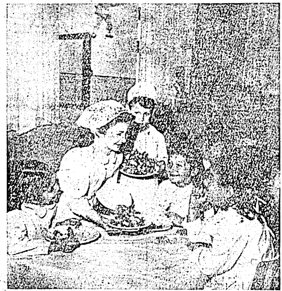
DUPA JOACA, O MASĂ BUNA NU STRICĂ