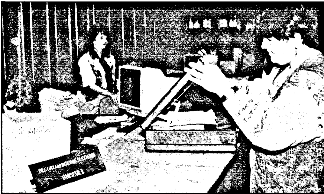
Activitate intensă la ghișeele pentru decontări...

Dacă Bancorex se adresează în principal agenților economici, asta nu înseamnă că a uitat persoanele fizice, ci dimpotrivă. Aceștia banca le pune la dispoziție diferite instrumente bancare avantajoase. Astfel, la Bancorex se pot constitui depozite în lei sau valută. Banca operează plăți în valută cu cărți de plată (carduri) pentru persoanele fizice străine și eliberează carduri VISA, Eurocard/Master Card clienților săi, de