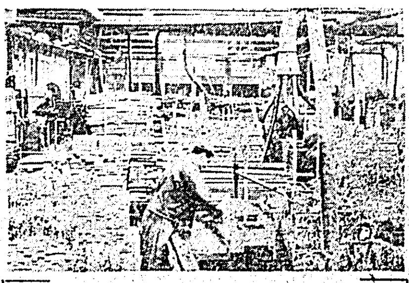
ÎN CLISEU: vă prezentăm un aspect din sectorul de mașini al fabricii de mobilă din Arad, unde spiritul de bună gospodărie ferește tot mai mult producția de consumul exagerat al materialului lemnos.