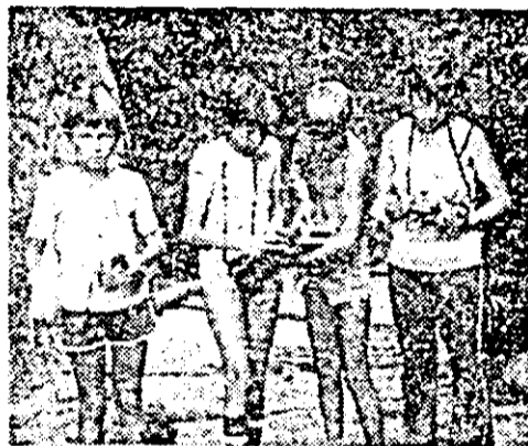
Pe drumuri de munte, cu aparatul de fotografiat, în căutarea celor mai frumoase imagini.