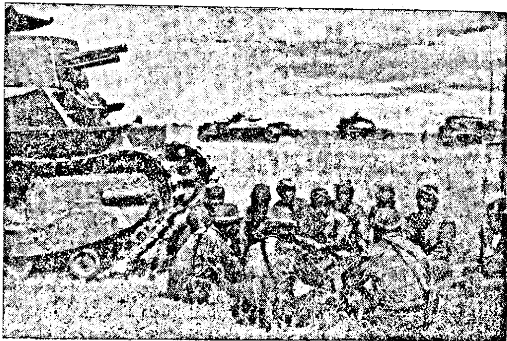
Scenă din războiul mongolico-japonez: tancurile japoneze au început a face ravagii.