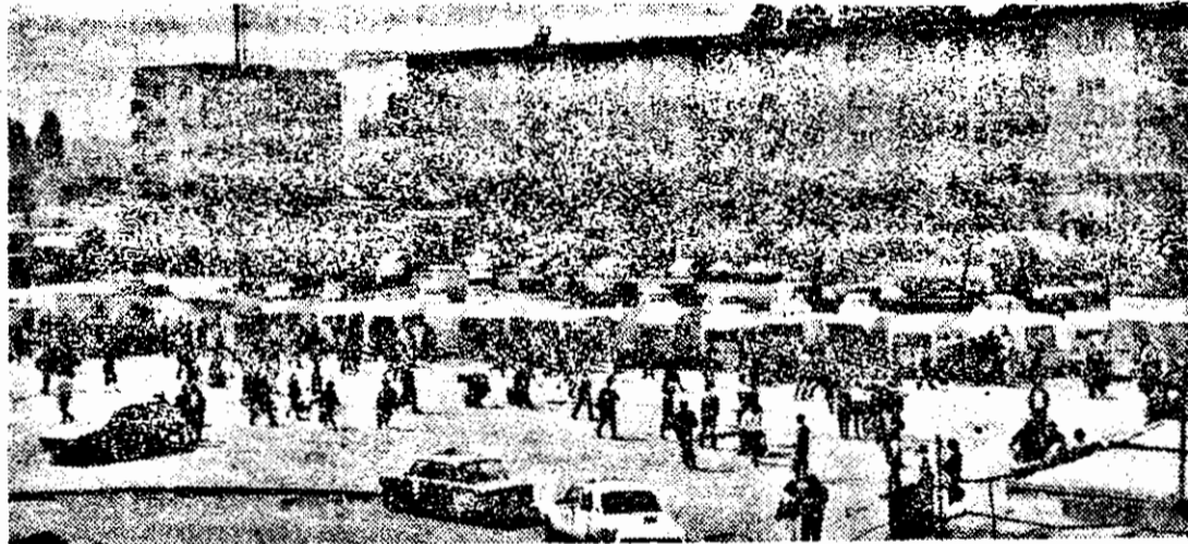
Piața gării sau cam ce înseamnă (deocamdată) la noi, privatizarea