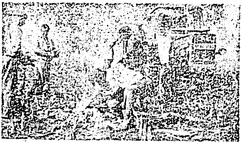
Recoltatul porumbului la C.A.P. Nădlac.