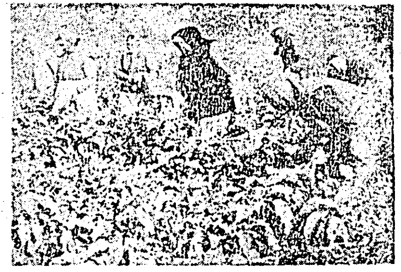
La cooperativa agricolă „Avîntul” din Pecica se adună ultimele vinele — clte 2.000—3.000 kg zilnic.

În timpul dejunului, care s-a desfășurat într-o atmosferă de căldă cordialitate, președintele Nicolae Ceaușescu și Marele Duce Jean au fost scurte toasuri.