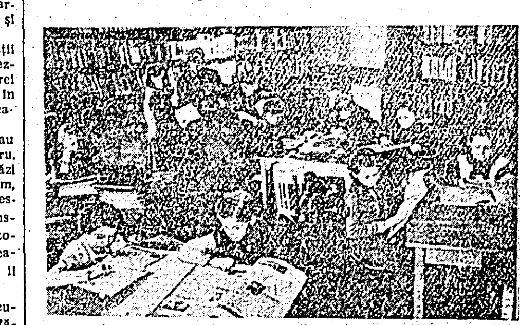
Zilnic la biblioteca de la Casa pionierilor e o animație deosebită. Zece de copii vin aici să schimbe și să citească cărți. La dispoziția lor stau rafturile încărcate cu mii de volume. Acum, în cadrul săptămînii cărții rominești, afluența de cititori e și mai mare. Mesele din incintă bibliotecii în jurul cărora pionierii pot citi în liniște, se dovedesc a fi neîncăpătoare. ÎN CLIȘEU: aspect din incinta bibliotecii de la Casa pionierilor.