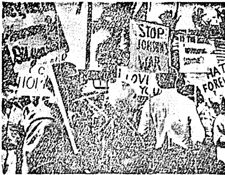
La Honolulu (Hawaia), cu ocazia unei recente conferințe, cetățenii orașului au protestat față de politica SUA în Vietnam

SAIGON 26 (Agerpres). — În delta fluviului Mekong, regiune situată la sud de Saigon, unitățile de patrioți sînt deosebit de active. Ele au atacat vineri noaptea, la My Loc (160 km sud de capitala sud-vietnameză) un avanpost guvernamental, a cărui garnizoană a înregistrat pierderi grele. În ajutorul soldaților guvernamentali au intervenit aviația și artileria. În așa-numitul sector al primei regiuni militare din apropierea orașului Quang Tri, trupele saigoneze desfășoară încă din 22 februarie o operațiune, dar nu au reușit să intre în contact deocultă de două ori cu forțele patrioțice în cursul cărora au suferit pierderi în oameni. Un purtător de cuvînt militar din Saigon a anunțat că cloacii violente au avut loc și în localitatea Hue, unde forțele guvernamentale au împins o forță puternică rezistentă din partea forțelor patrioțice. Simbătă dimineață, la baza americană de la Chu Lai, patrioții au lansat un puternic atac în cursul cărui mai mulți pîncași ai marinei americane au fost ucși.