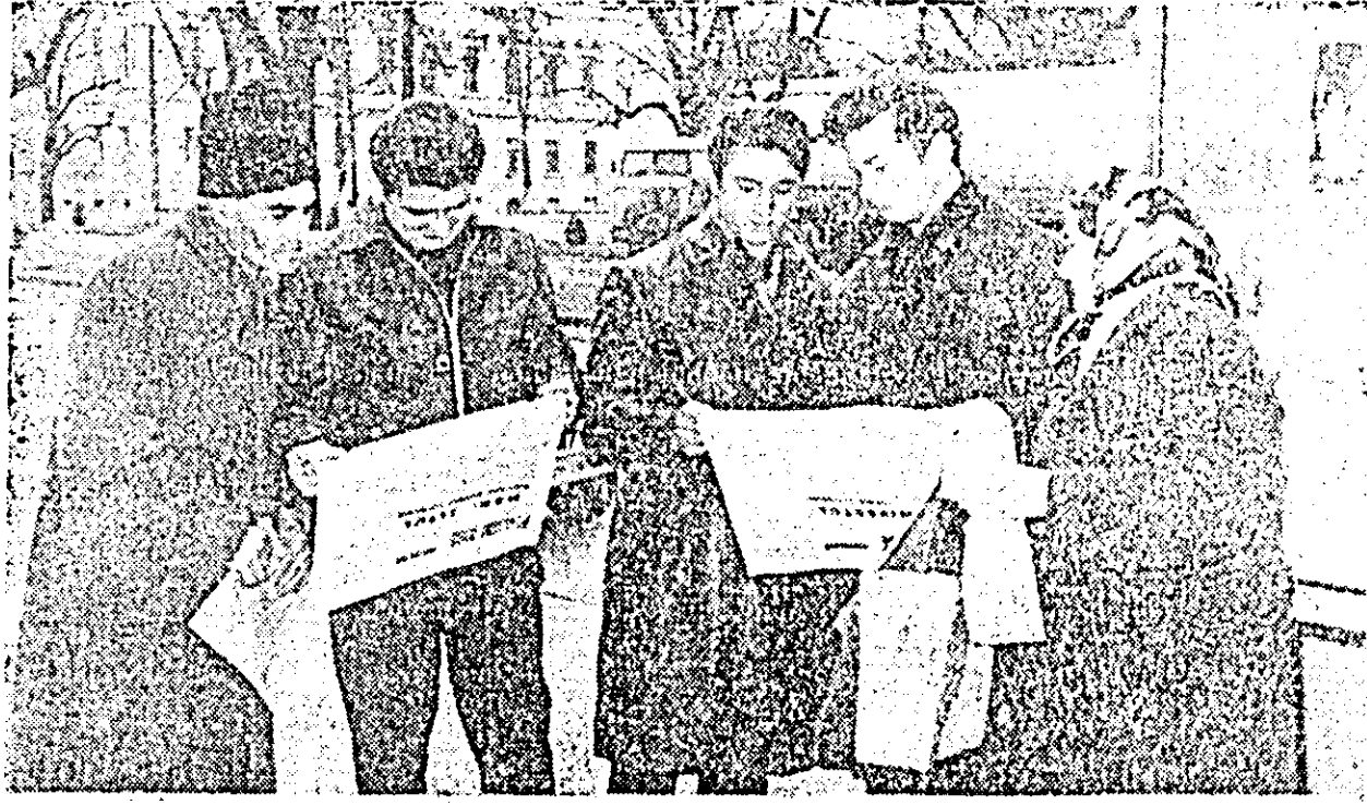
Apariția în presă a Manifestului Frontului Unității Socialiste a fost primită cu deosebit interes de către locuitorii Aradului.