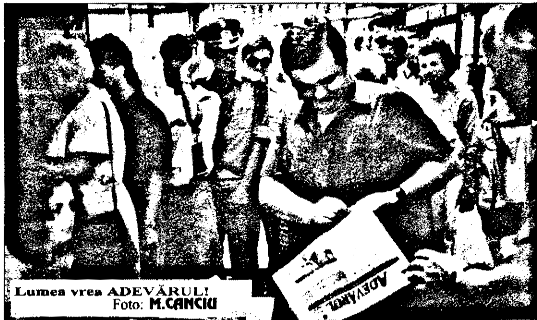
Lumea vrea ADEVĂRUL!