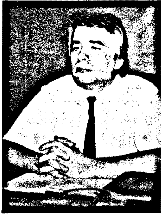
jefuire. Interlocutor domnul putea intra fără nici o legiti-