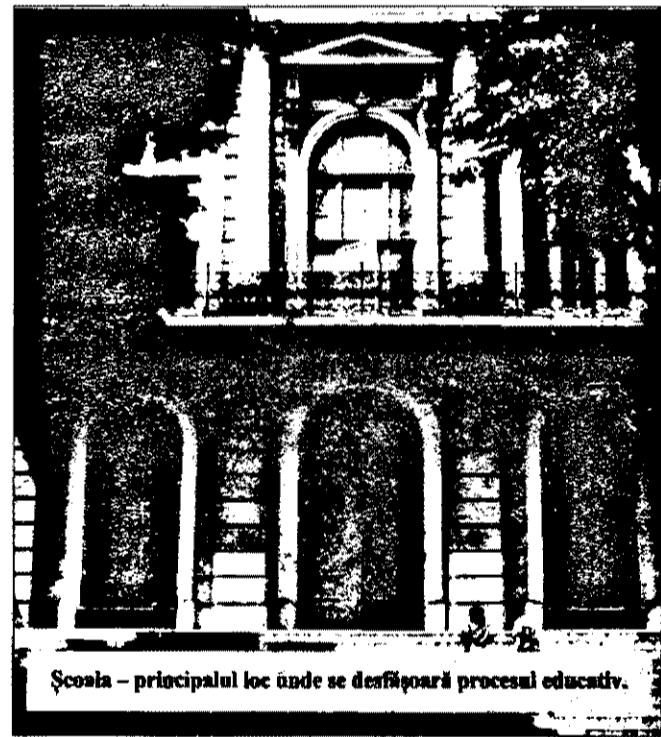
Școala - principalul loc unde se desfășoară procesul educativ.

C omunicările prezentate s-au circumscris temei interdisciplinarității ca modalitate de predare-învățare în învățământul preuniversitar.