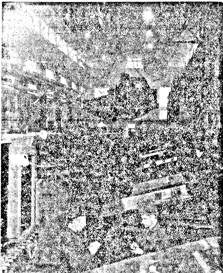
A moszkvai „KIROV” nehézipari gyárban készült, mezőgazdaságban használt traktorok.

Részletes tudnivalókat az Állami Sorsjáték bármelyik székhelyén díjmentesen kapható prospektusok közölnek.