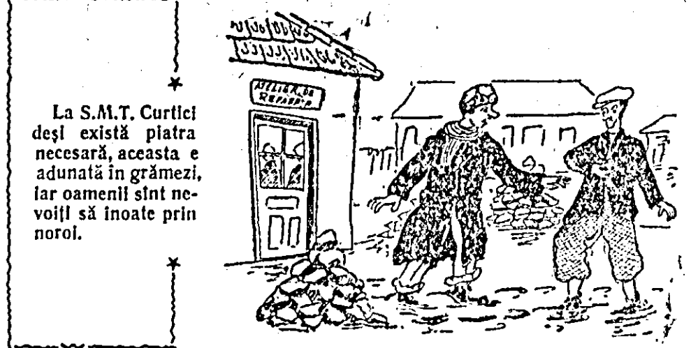
La S.M.T. Curtici deși există platra necesară, aceasta e adunată în grămezi, iar oamenii sînt nevoiți să inoate prin noroi.

Conducerea S.M.T.-urilor, organizațiile de partid și U.T.M. precum și comitetele de întreprindere, trebuie să fie pătrunse de marea sarcină ce le revine acum, să nu se liniștească nici o clipă pînă cînd nu vor ști că întregul utilaj agricol e gata să pornească în orice clipă cu el la cîmp, la lucru. Organele de partid și de stat au datorita să dea de îndrumări practice și să controleze îndeaproape cum se muncește pentru îndeplinirea la vreme a planului de reparații.