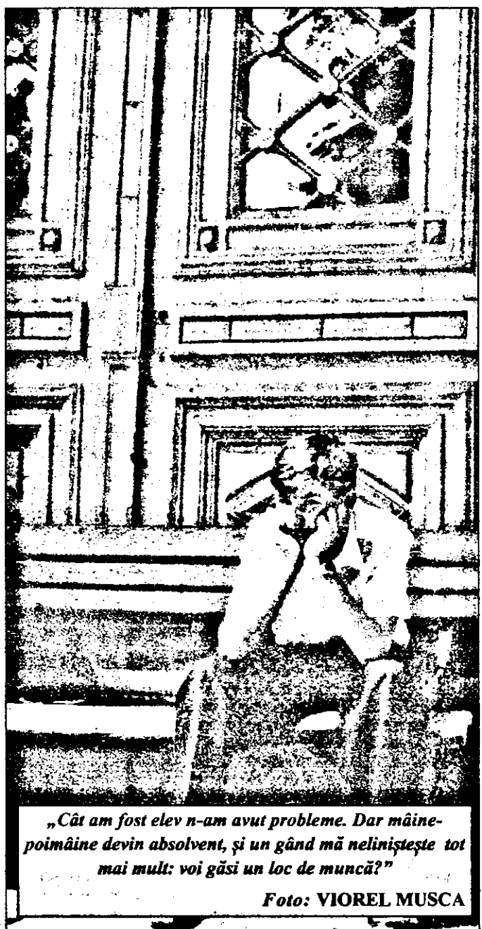
„Cât am fost elev n-am avut probleme. Dar mâine-poimâine devin absolvent, și un gând mă neliniștește tot mai mult: voi găsi un loc de muncă?”