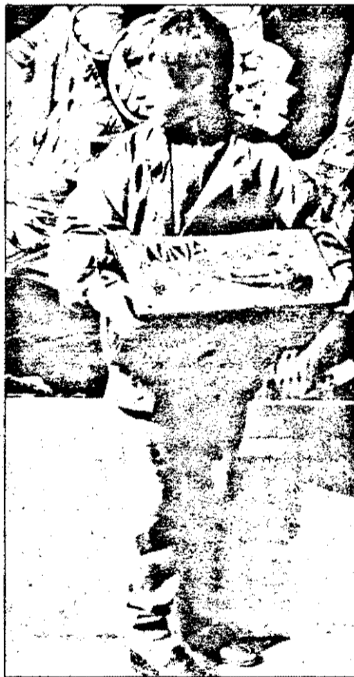
Senzațional: la Arad, în septembrie '93, un copil a primit cadou o jucărie.