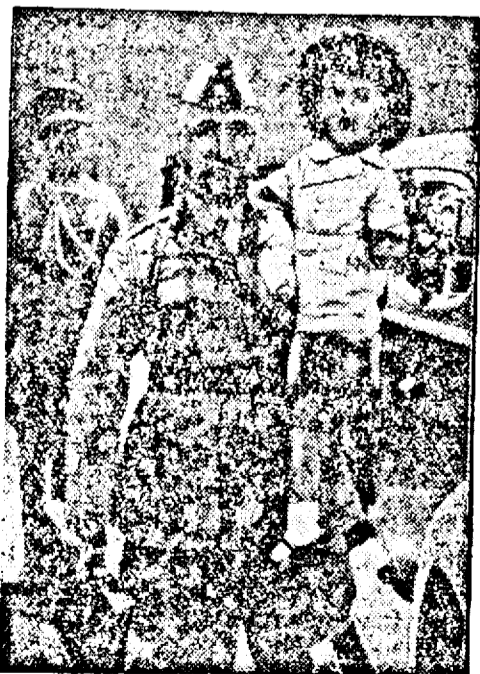
Regele și ofițerul său de ordonanță. Copilul, pe care acest ofițer îl duce cu atât respect, este cel mai tânăr rege, Feisal II. al Irakului.