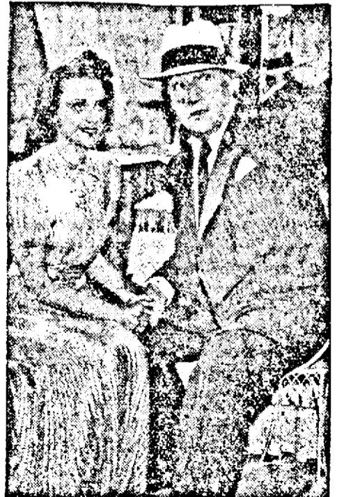
Actorul autor-regisor francez Sacha Guitry s'a căsătorit pentru a patra oară cu partenera sa Genevieve de Sererville. Iată perechea fericiată pozând pentru fotografi.