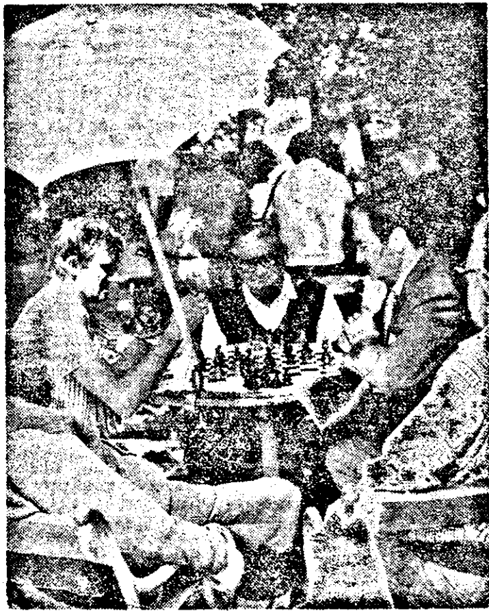
Șah mat... sub umbrelă!

● Reacționînd la proaspătul tratat de amiciție și cooperare între Croația și Bosnia și Herțegovina, semnat marți la Zagreb de președintele Franjo Tuđman și Alija Izetbegović, președintele sîrb Slobodan Milošević și-a rearmat sprijinul pentru „lupta dreaptă” a sîrbilor din Bosnia și Herțegovina.