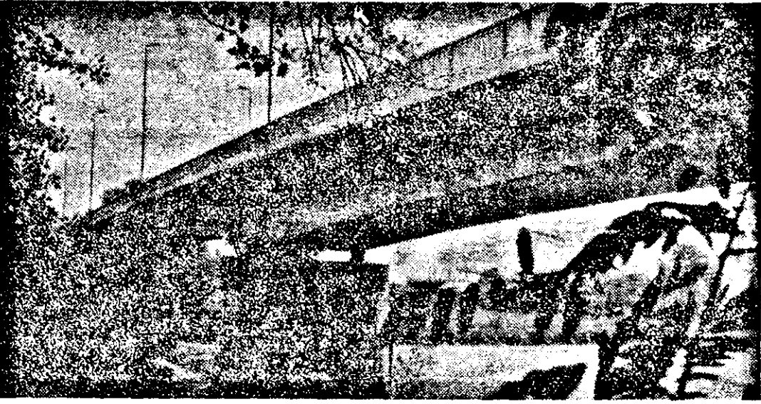
Arc peste Mureș!

Cotidian Independent — J 02/nr. 1886/1991 ANUL IV | Nr. 732 | Sîmbătă 10 X - Duminică 11 X '92 | 8 pag. — 10 lei