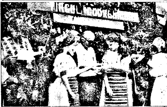
Flori alese ale cântecului și portului popular românesc