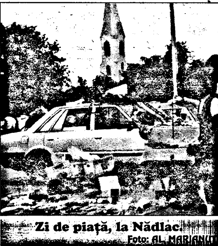
Zi de piață, la Nădlac.