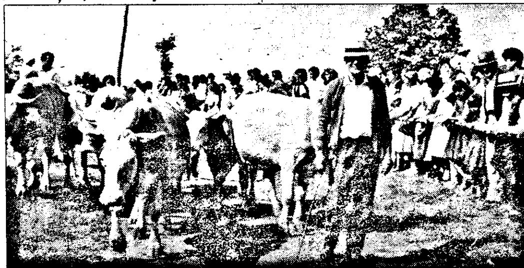
Gospodarii din Văsoaia au cu ce se mândri.

(Continuare în pagina a 6-a) ➔