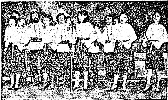
Secvență din spectacol.