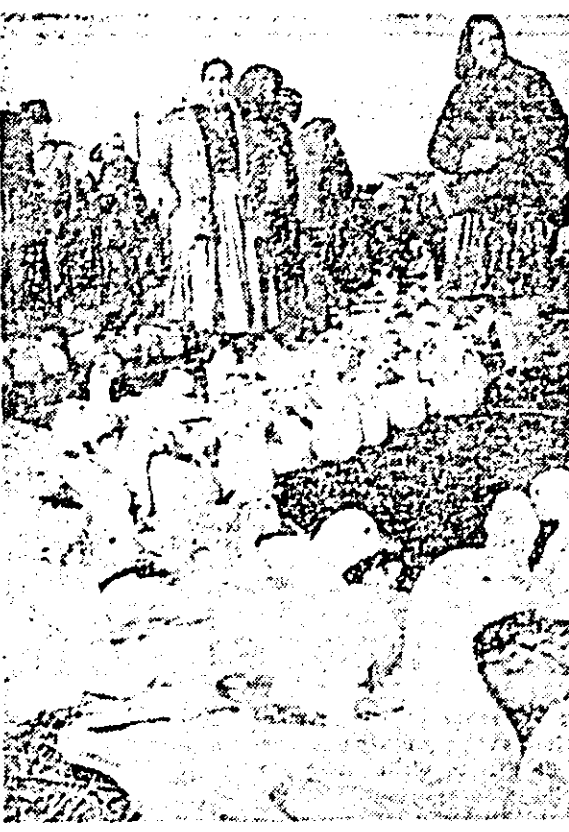
Piață o cloră și trei „feluri do” anemice... Pe cînd și pastramă de gîscă?

În vederea creării unor condiții cât mai bune pentru desfășurarea în piața orașului a unui comerț civilizat, edilii orașului de pe Crișul Alb au întreprins o serie de măsuri. Printre acestea se numără și efectuarea, cu câțiva ani în urmă, a cinci construcții, fiecare cu câte două încăperi. O inițiativă bună, lăudabilă și apreciată la timpul respectiv. Păcat însă că aceste spații comerciale, pentru care s-au investit ceva fonduri, nu sînt folosite în mod corespunzător. Unele din cele zece încăperi sînt folosite ca birouri, magazii etc. Chiar și acelea în care s-au instalat unele unități comerciale, în plină zi de piață, erau închise. De unde concluzia că treburile în piața de aici nu sînt tocmai bine organizate. Pentru că ni se pare mai normal ca mărfurile să fie desfășurate în locuri special amenajate, decît direct pe vatra pieții.