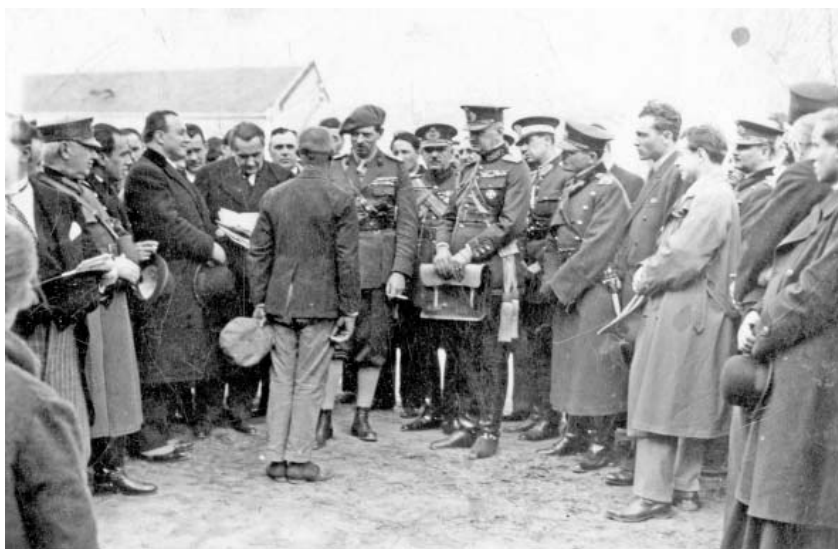
Regele Carol al II-lea sosit cu ocazia inundatiilor din 1932