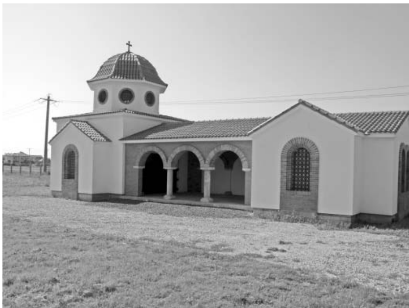
Moderna capelă a cimitirului din Sânicolaul Mic

biserică, obligându-i chiar să lucreze în zilele de sărbătoare dând seama sub formă statistică despre ce au realizat în aceste zile.