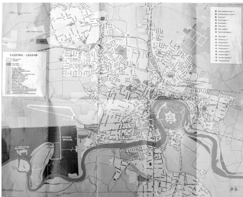
Imagine document cu ocazia Zilele cartierului

doi metri, pământul s-a așezat, iar apa a pătruns undeva în adâncimi. La casa vecină, de la nr. 44, pe o suprafață ceva mai mare, apa s-a scurs în adâncuri în cantități foarte mari, fără nici o greutate. Se presupune că în această zonă ar fi o mare săpătură (tunele subterane), poate că în legătură cu Cetatea Aradului.