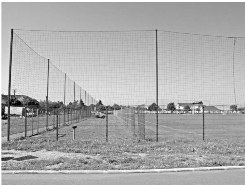
Terenul de fotbal al cartierului

Balul sportivilor era frecventat an de an de toți iubitorii sportului. De remarcat că în echipele de fotbal jucau un număr însemnat de sportivi din rândul populației germane. Fetele se dădeau în vânt după sportivi, una dintre ele povestea: „Ce ți-e și cu tinerețea asta, când eram tânără, nu era bal, horă sau orice petrecere unde erau îndeosebi sportivi unde să nu fiu eu înainte. Nu eram frumoasă, că eram negruță la față, dar aveam părul creț și eram așa de ciudată de pe toți îi învârteam după deget, fugeau după mine. Dar, credeți că mă prindea vreunul? Nici măcar unul, iar acum când vă povestesc, am sărit bine peste 60 de ani.”