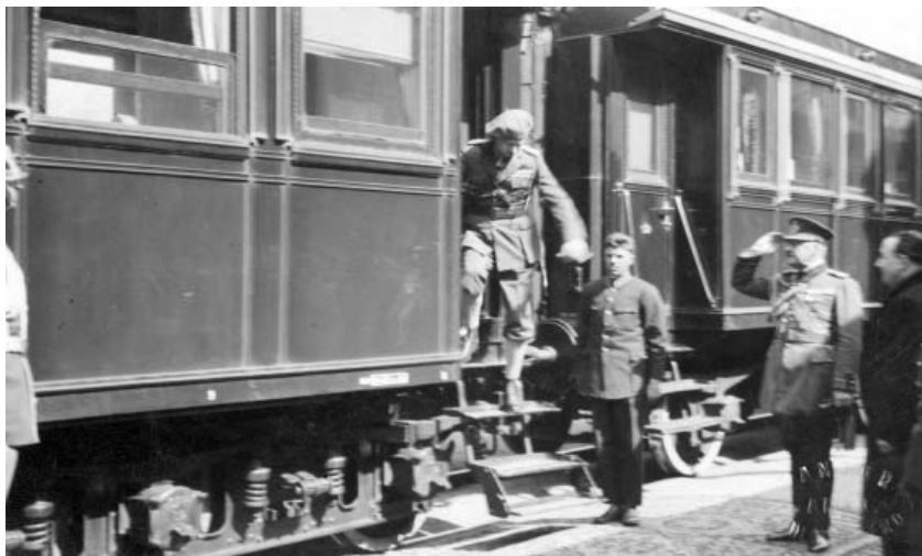
Carol al II-lea coboară în Gara Arad în anul 1932