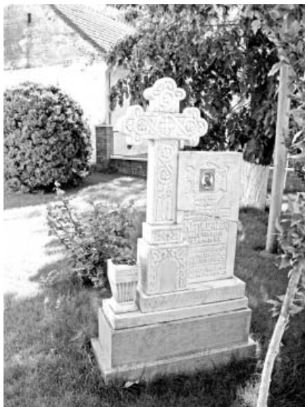
Alt monument ridicat în cinstea eroilor din Sanicolaul Mic în curtea Bisericii Ortodoxe