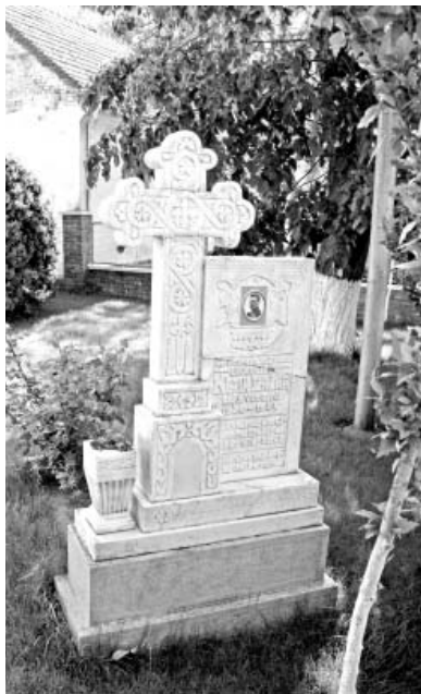
Alt monument ridicat în cinstea eroilor din Sânicolaul Mic în curtea Bisericii Ortodoxe

fost grupați la marginea satului, pe strada Tarafului, unde mai există și în prezent un număr restrâns de familii.