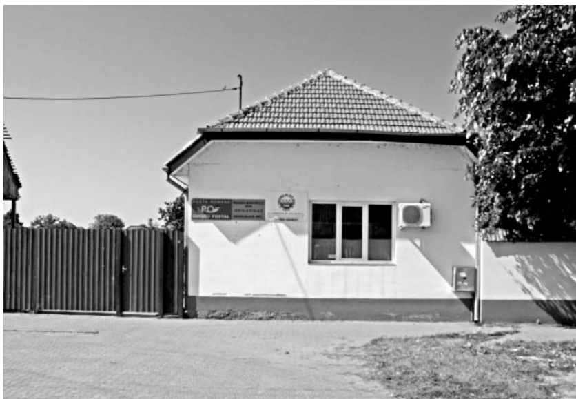
Cladirea fostei Primarii a comunei Sanicolaul Mic

Au murit pe câmpuri de luptă 55 de milioane de oameni. România a contribuit cu 1 miliard de dolari, care echivala cu de patru ori bugetul țării pe anii 1937-1938.