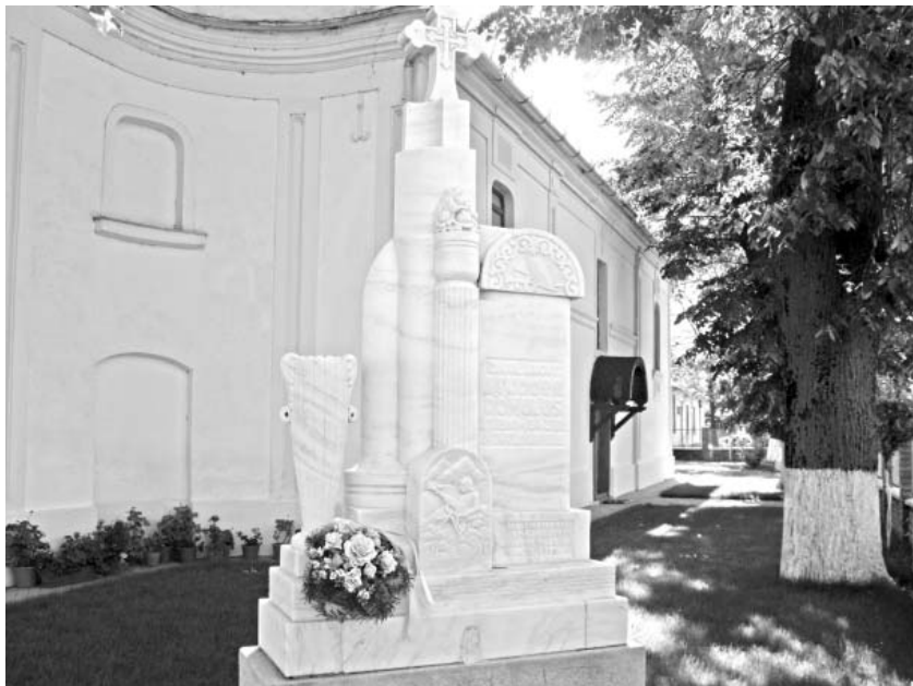
Monumentul eroilor căzuți în al Doilea Război Mondial din curtea Bisericii Ortodoxe