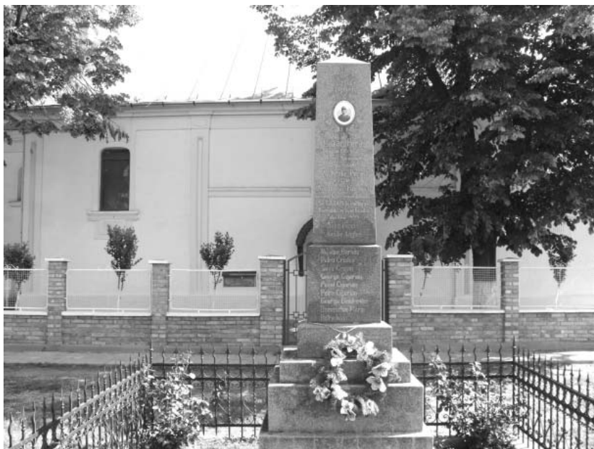
Monumentul eroilor căzuți în Primul Război Mondial din curtea Bisericii Ortodoxe