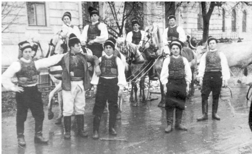
Colindători din Sânicolaul Mic la începutul secolului trecut

Rostul acestui obicei era ca în anul următor să fie tot așa de bogat, de sănătos și să nu aibă neghină. Tot cu ocazia seceratului