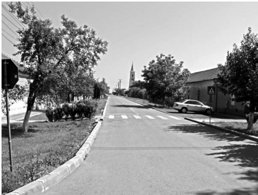
Strada Frumoasă care duce către Biserica Romano-Catolică

Dacă în anul 1812 erau 25 de familii germane și 1.000 de români, în anul 1948 erau 1.555 de germani și 1.200 de români.