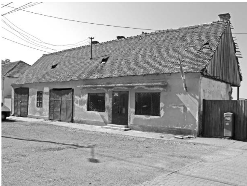
Anexa de la fosta Primărie a comunei

Alegătorii români simțeau că ziarul este aproape de ei și că nu sunt singuri în fața autorităților. De fapt, se pregătea terenul pentru marile confruntări parlamentare ce aveau să urmeze, alegerile din comitat fiind privite și instrumentate de către tribuniștii arădeni ca un veritabil exercițiu electoral. În acest sens, tribuniștii sunt extrem de sensibili față de minoritățile nemaghiare din comitat, popularizând colaborarea electorală dintre acestea: „ E interesant că în câteva locuri, în cercuri mixte, ca la Păuliș, nemții au votat cu românii. Iar la Șiria ungurească, nemții nu s-au dus la vot numai să nu trebuiască să voteze cu ungurii. Astfel au și ajutat românilor din acel cerc. ” 52 De asemenea, în cazurile neînțelegerilor inter-confesionale, tribuniștii acționează cu maximă prudență, pentru a nu stârni orgoliile celor implicați: „ Nu putem suprima regretul, că