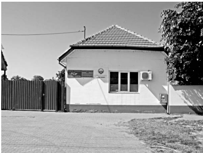
Clădirea fostei Primării a comunei Sânicolaul Mic