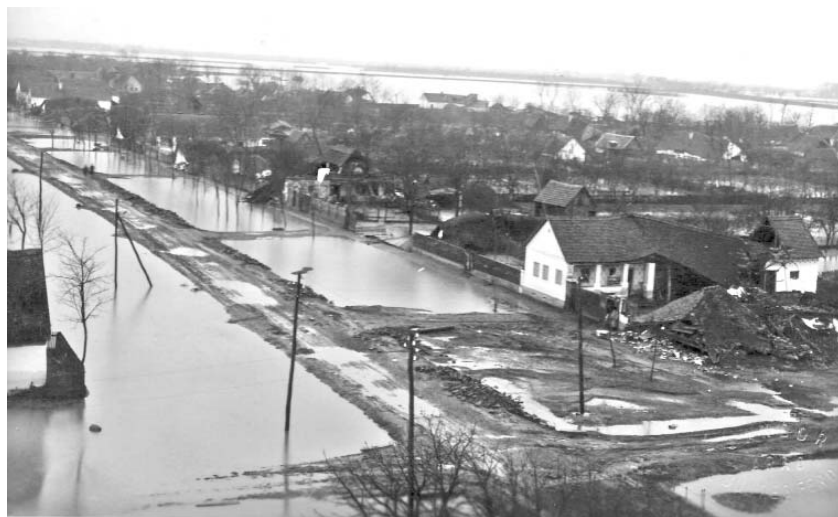
Inundațiile din anul 1932

Și parcă nenorocirile nu vin niciodată singure. În perioadele ce au urmat, și localitatea noastră a avut de suferit din cauza inundațiilor repetate a Luncii Mureșului (Hadă), bătrânii încă își mai amintesc de dezastruoasele inundații din anul 1932; inundații s-au mai repetat și în anii 1970, 1980, 1985.