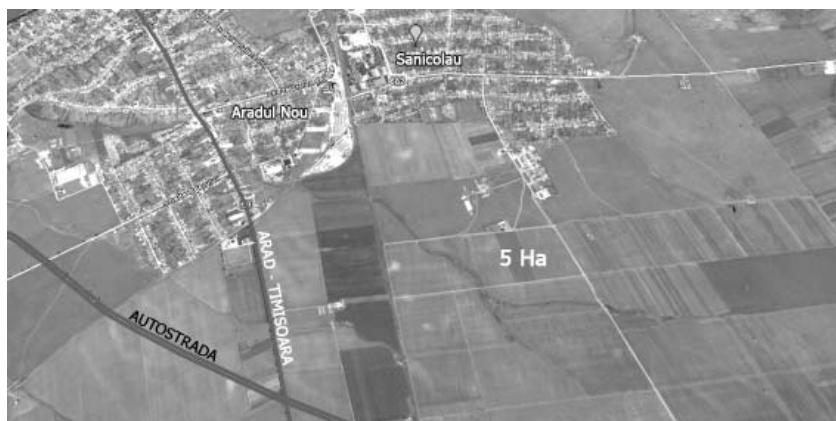
Imaginea aeriană a cartierului

Pentru orașul Arad și împrejurimi, o mare realizare a fost crearea Uzinei Electrice Arad (1895), cu o producție de 2.079.153 WO.