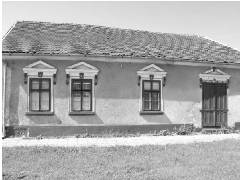
Fosta farmacie - o clădire tipică pentru începutul secolului trecut

Peste puțină vreme a venit însă un moment greu pentru țară, pentru că se găsea singură, fără nici un sprijin din afară. Vestea celor hotărâte la Viena a străbătut ca un fulger întreaga țară. A determinat o atitudine hotărâtă de a rezista cu orice preț. Din toate colțurile țării s-a dat din nou glas versurilor lui Andrei Mureșan: