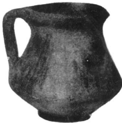
Vas ceramic dacic descoperit la Sânicolaul Mic

Începând din secolul al XII-lea, anumite organizații bisericesti de rit occidental îndeplineau și funcții administrative, „Loca CREDIBILA” făcând funcții procesuale, copii de documente, delimitări de domenii, introducerea în proprietate a noului stăpân. În fața lor se făcea orice