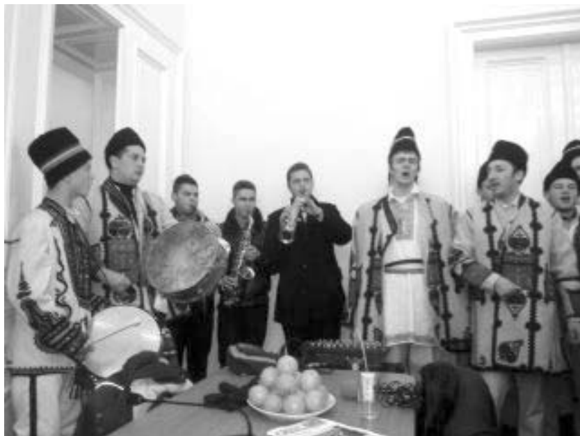
Dubașii din Sânicolaul Mic

Nu am reușit să consemnăm anul în care a început organizarea comunei pe străzi, știu însă că pe la sfârșitul secolului al XVIII-lea evidența populației se ținea pe numere de casă (fumuri), de