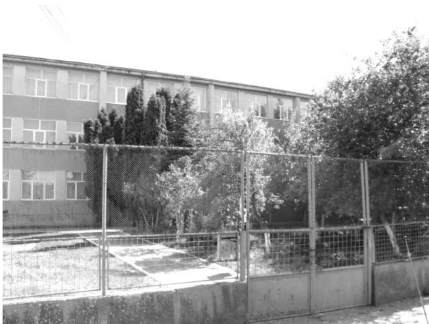
Școala Generală din Sânicolaul Mic

Vom prezenta câțiva conducători de școli, precum și dascăli, care în decursul anilor începând cu 1774 și până în anul 2000 au avut și funcții de conducere în școală.