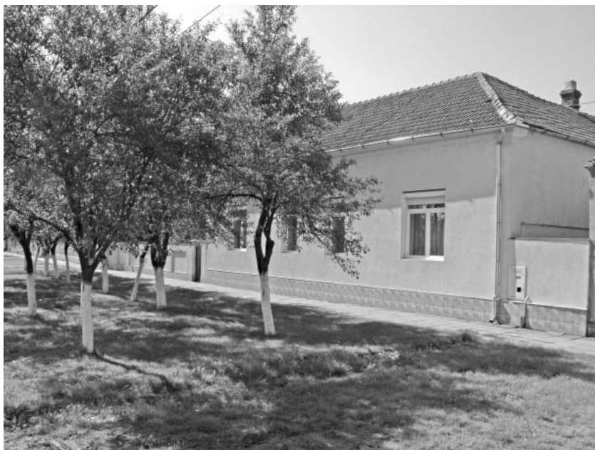
Casa parohială ortodoxă din Sânicolaul Mic

În jurul anului 1900, populația a crescut mult, au fost aproximativ 1.250 de germani și 1.000 de ortodocși. Au mai existat și alte religii, 7 evanghelici, 7 reformați, 6 evrei.