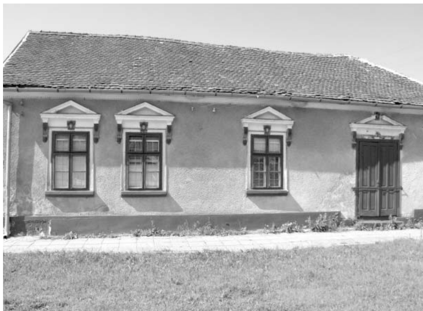
Fosta farmacie - o clădire tipică pentru începutul secolului trecut

Bătrânii satului povestesc că de când se știu în Sânicolaul-Mic a există farmacie, unde găseai aproape tot ce aveai nevoie.