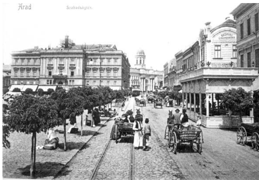
Agricultorii din Sanicolaul Mic veneau cu produse la Piata din Arad 1890

Printre fabricile mai mari se situa Fabrica de Vagoane I. Weitzer, cu peste 1.400 de muncitori, Fabrica de Automobile „Marta”, cu