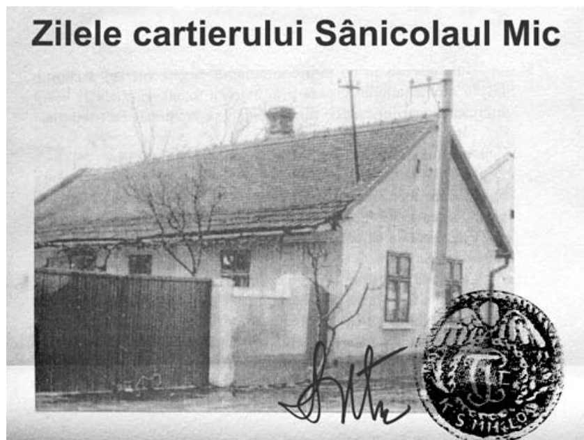
Imagine document cu ocazia Zilelor cartierului

Pe strada Gheoghe Stoica, la nr. 42-44, cantitățile foarte mari de apă provenite din acea ploaie torențială au pătruns în curțile celor două case; la nr. 44 (42?), proprietarul Susan Avram povestea că lângă poartă, unde terenul era asfaltat, pe o suprafață de aproape