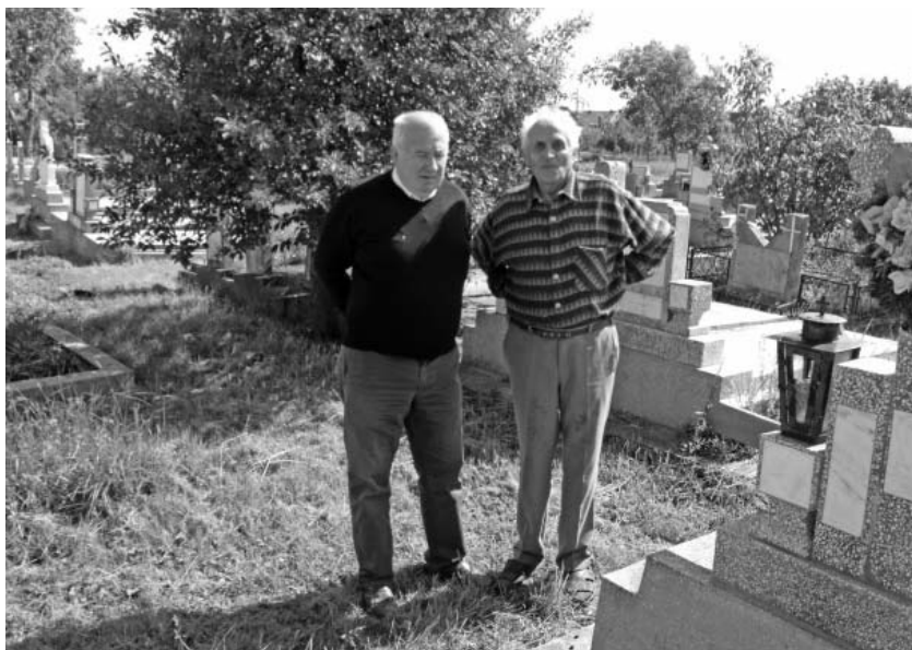
Cei doi monografi ai cartierului Sanicolaul Mic

cartier, casele sunt construite peste morminte. O mare grijă am avut ca toate strădaniile și preocupările mele din această perioadă să fie percepute și înțelese, mai ales de către localnicii băștinași, în sensul că nu am intenția de a satisface un orgoliu personal al unui venit chiar și cu cincizeci de ani în urmă și mai ales fără nici un fel de ambiții de a-i căuta la rădăcină. În firea mea nu există asemenea orgolii, ci doar dorința sinceră și un sentiment lăuntric deosebit, poate și de atunci când, pentru scurtă vreme, m-am ocupat cu toată puterea de gospodărirea acestui cartier în calitate de deputat, cu dorința de a lăsa în urma mea dacă se poate cât mai multe mărturii la îndemâna celor care vor veni despre cei care au fost pe aceste locuri. Cu mulți ani în urmă, auzisem o frumoasă predică plină de semnificații ținută de părintele protopop Traian Gavrilă, apreciatul paroh al bisericii, care spunea: