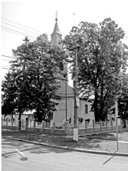
Biserica ortodoxa din Sanicolaul Mic

Biserica din Sânicolaul-Mic, frumos pictată și bine îngrijită, în noaptea de 5 septembrie 1992 a luat foc. Nu se știe nici astăzi care au fost cauzele adevărate, pentru că un raport oficial în urma cercetărilor întreprinse nu se cunoaște. Mare amărăciune au avut în suflet credincioșii acestei parohii când au văzut dezastrul.