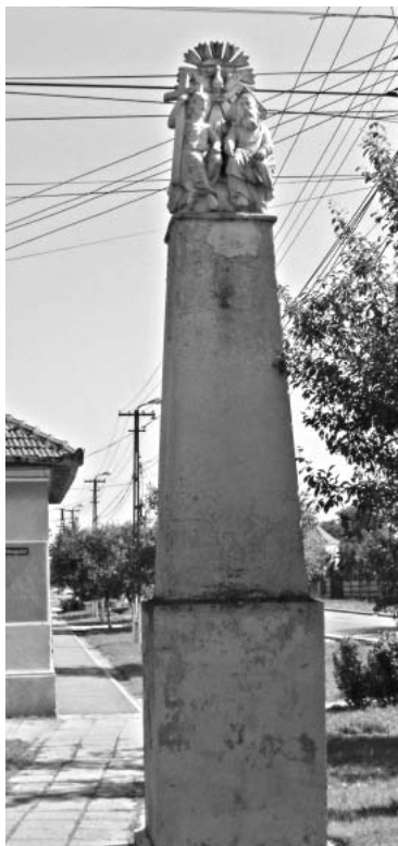
Monumentul Sfintei Treimi de la intersecția cu Strada Frumoasă

Își păstrau cu strășnicie obiceiurile tradiționale, îndeosebi cele religioase. Credincioșii catolici, îndeosebi cei germani, nu s-au abătut în nici o împrejurare de la credința lor, nici chiar în perioade grele pentru biserică. Această etnie nu a ținut seama de nici o indicație, respectându-și tradiția strămoșească.