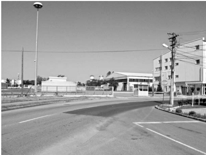
Zona industrială a cartierului

Fabrica avea o secție la Gurahonț, care colecta fructele din zonă, aici se produceau compoturi și mai ales cunoscuta marmeladă de Gurahonț. Fabrica avea și un caracter sezonier, prin faptul că pe lângă muncitorii calificați aici lucrau mulți muncitori sezonieri, timp de șase, șapte luni pe an. Tot în această fabrică făceau practică de producție elevii școlii profesionale de industrie alimentară și cei ai Liceului Agricol.