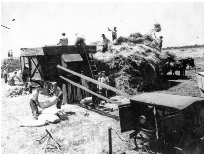
Treieratul grâului la Sânicolaul Mic, 1938