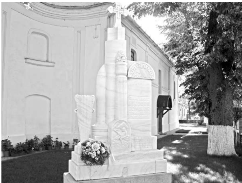
Monumentul eroilor căzuți în al Doilea Război Mondial din curtea Bisericii Ortodoxe

mondiale, pentru că frecvent se întâmpla ca de pe front, așa cum am mai arătat, multor tineri le mai venea doar vestea că au căzut în luptă, iar alții au dispărut fără a se afla vreo veste despre ei. Cei care au avut ocazia să viziteze comitirul catolic din localitate vor observa că pe monumentul din cimitir sunt un număr însemnat de nume de eroi căzuți în lupta pentru apărarea patriei.