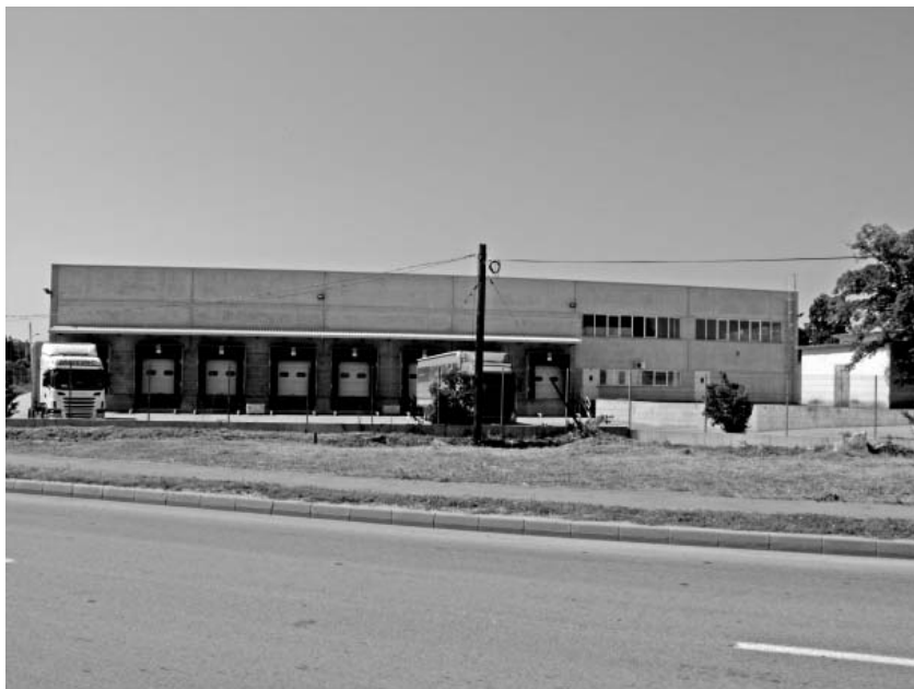
Cartierul are o zonă industrială de invidiat

- Ordinul Muncii Clasa a II-a pentru activitatea depusă în anii 1978 și 1979;