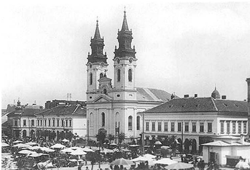
Catedrala veche în anul 1890

Aceasta este încă o dovadă că și populația din zona noastră și-a păstrat religia străbună ortodoxă, care a rezistat tuturor încercărilor de catolicizare.