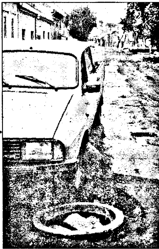
Lipsa unui capac de la o gură de canal de pe str. Octavian Goga oferă „surprize” cât se poate de neplăcute șoferilor neavizați! Și nu e singura stradă cu asemenea... capcane!