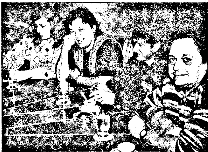
„PASAREA COLIBRI”. Adica Florian Pittis, Mircea Baniciu, Vladi Cnejevici si Mircea Vintila.

afirma membrii formatiei „PASAREA COLIBRI”