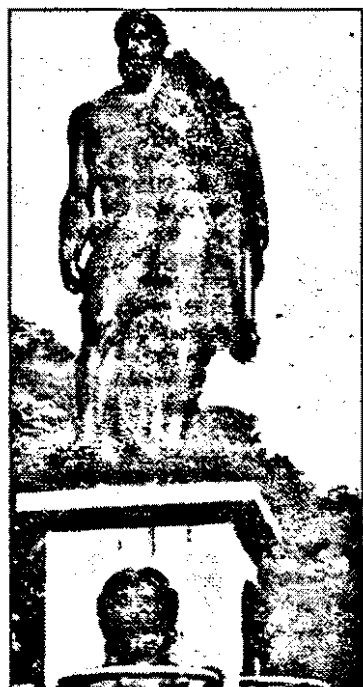
România a avut întotdeauna români înafara granițelor; în regimul comunist, românii aceștia au constituit o categorie interzisă și ocolită în mod sistematic. Vechile cărți despre ei au fost puse la index, iar cărțile noi, despre românii

din diasporă, cenzurate. Dintre țările Europei de Est, România, care a suportat până și amputări teritoriale importante, s-a confruntat cu o situație specială și foarte grea. Avea români în toate țările lumii, fără să-i poată reuni și fără să-i poată revendica. Această ignorare forțată; impusă, a avut consecințe pentru conștiința unității noastre naționale în general. Acești români din afara granițelor țării s-au aflat în greua situație că au început să-și uite originea și chiar să-și piardă identitatea. Revoluția din Decembrie 1989 a restituit românilor posibilitatea contactelor libere, șansa revendicării identității culturale și etnice. Ceea ce înainte de Decembrie 1989 părea de domeniul utopiei - organizarea unui forum al românilor de pretutindeni, regăsindu-se laolaltă, dincolo de vederi politice și opțiuni politice, doar în calitatea lor de români liberi, de fii ai aceluiași popor - este perfect posibil în