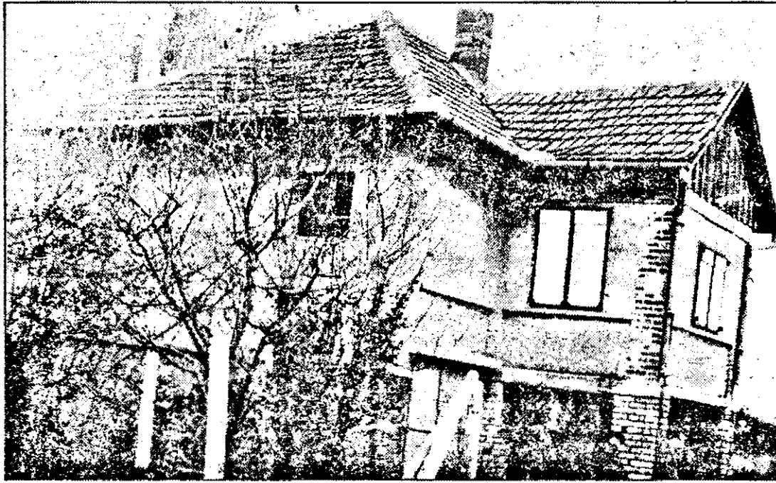
„Colna” în care s-a născut cel care se crede Mesia Primăriei din Arad.