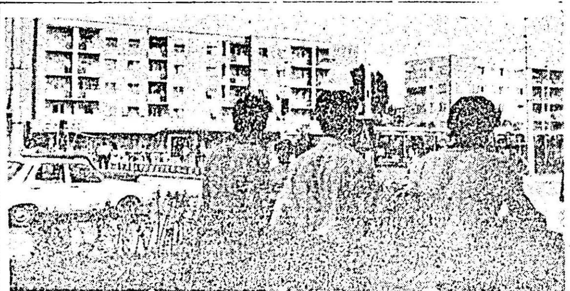
Tineretea unui cartier

• Datorită stabeli preocupării a conducătorilor unităților, a specialiștilor în 27 ferme de vaci ale cooperativei agricole se obțin producții scăzute de lapte, ceea ce impune să se ia măsuri energice pentru redresarea situației, conducătorii consiliilor unice fiind chemate să acționeze sistematic, cu tot simțul de răspundere pentru îmbunătățirea continuă a activității în toate fermele zootehnice.