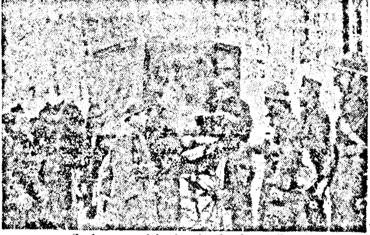
Sosirea sapei in dosul primilor linii.