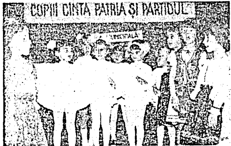
Imagine de la concursul de interpretare artistică „Șoimii patriei cîntă patria și partidul”, etapa municipală ce a avut loc, recent, la C.P.S.P. Arad. În fotografie: Șoimii de la Grădinița p.n. nr. 5 Arad.