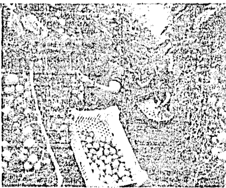
Se strînge bogata recoltă de tomate de la A.E.S.C. Seve Arad.