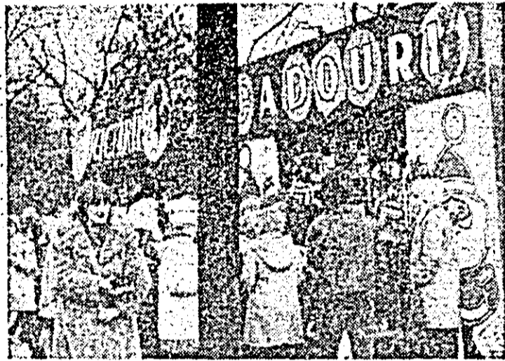
De câteva zile a început vacanța de iarnă. Între numeroase bucurii oferite, în această perioadă, copiilor, se numără și tradiționalul „Orășel al copiilor”, loc în care — după cum se poate constata și din instantaneul surprins — imaginea de mai sus — domină din plin voaloșia.