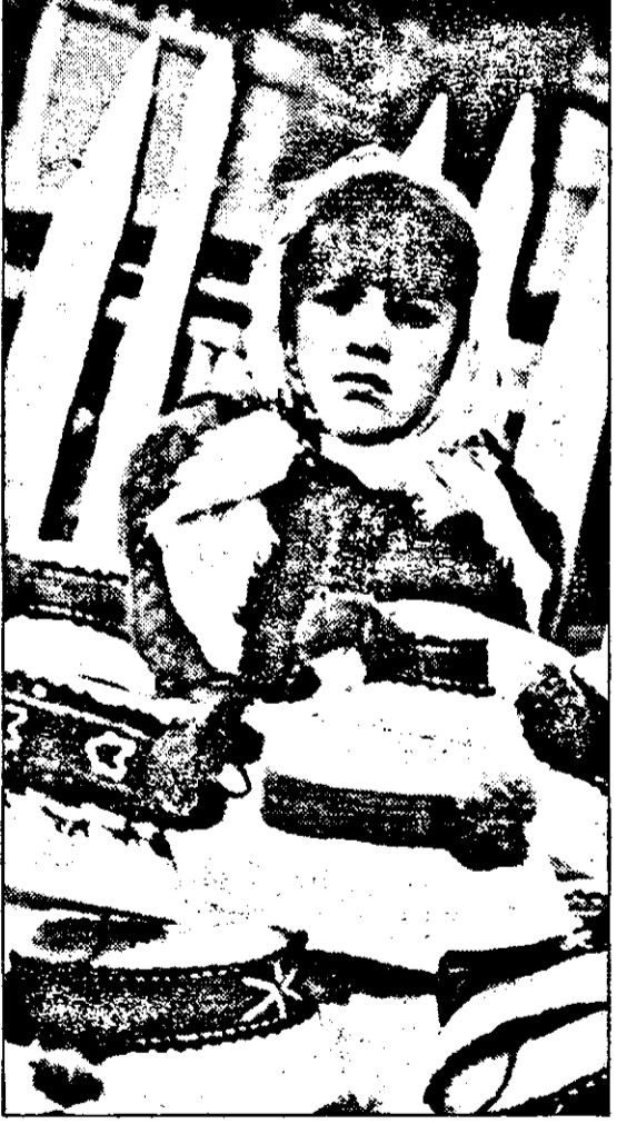
„Cloape is, da' unde-or fi ficiorii să le poarte?”

„Avangardism” ecologic la Arad - D-le președinte, cum se explică vizita d-voastră la Arad? - Răspunsul e simplu. Sunt de câteva zile în Banat. S-au împlinit cele 200 de zile ale Contractului cu România, noi am păstrat discreția față de acest contract, și așa era elegant pentru că am sprijinit Convenția și programul său politic. Am lăsat să treacă cele 200 de zile, dar acum ieșim la rampă. Veți vedea că nu ieșim ca să-i tămăim pe cei de la guvernare, ci o să le spunem lucruri dure și foarte serioase. Am început un turneu de întâlniri cu județele din această parte a țării. Am avut discuții la Timișoara, la Reșița și acum sunt la Arad. În mod fericit, întâlnirile noastre pe linie de partid la Arad coincid cu acțiuni care nu sunt doar ale MER, ci sunt și ale cetății, ale Primăriei, ale Consiliului Județean. Am ținut să fru aici pentru că Universitatea „V. Goldiș” al cărei rector este prof. Ardelean, președintele MER pe județ, e implicată serios în mișcarea ecologistă. Ceea ce se întâmplă la Arad sunt lucruri de avangardă.