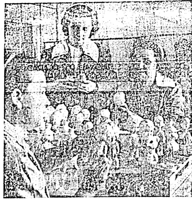
În atelierul de vopsit de la întreprinderea „Arădeanca” se lucrează la noi produse.

Zilele trecute, în comuna Seceani s-a desfășurat concursul formațiilor voluntare de pompieri „Faza sector”. La concurs s-au prezentat formațiile din Vinga, Mailat, Orșoara, satul Călacea și Seceani. Pe locul I s-a clasat formația din comuna Vinga, care în concurs a dovedit cea mai operativă activitate de intervenție.