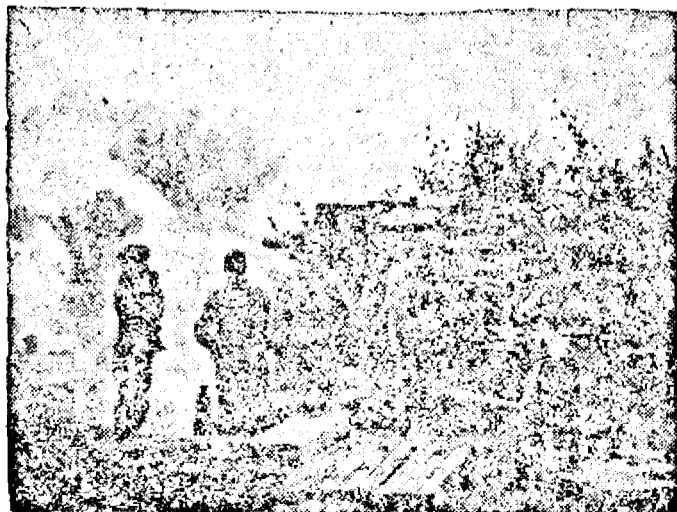
Artileria grea germană, în acțiune la Petersburg.

Politia britanică a trebuit să tragă asupra mulțimii. Au fost omorâți șase hinduși iar 15 au fost răniți.