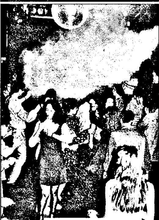
Fum de scenă, fete frumoase și distracție cât încap, la Disco Sfînx.

Începând de joi, Departamentul de Tineret al ziarului „Adevărul” organizează împreună cu discoteca „Mega Sfînx” o nouă ediție a binecunoscutelor „Joi studentești”.