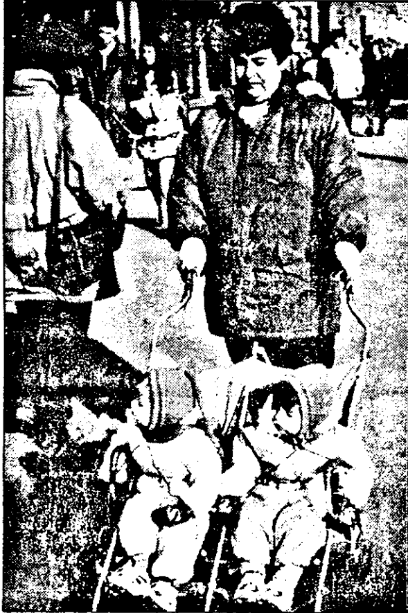
„Om și noi gement dar, dacă vine iarna și ne-o fi tot așa de frig, am terminat cu „coalitia”!...