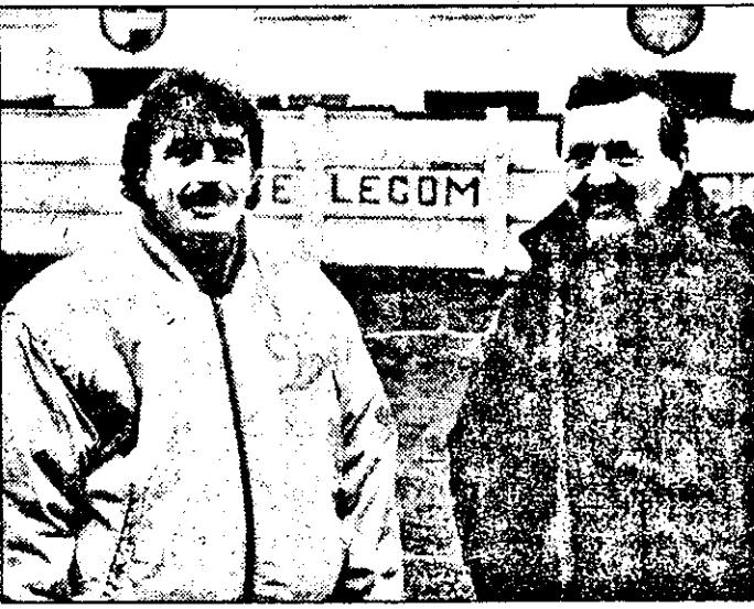
Surzătorii înainte de meci, Țârlea și Vidac erau negri de supărare la finalul partidei F.C. Arad Telecom - Olimpia Gherla, scor 1-1.