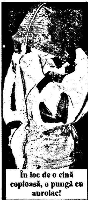
În loc de o cină copioasă, o pungă cu aurolac!