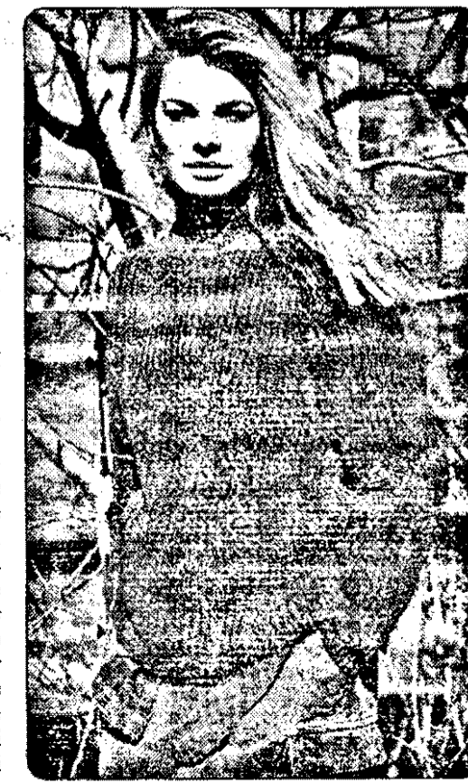
A venit, a venit iar toamna...

Se încălzește cuptorul. Cu un mixer, se bat bine zahărul (50 g), brânza dulce și scorțișoara. Se încorporează primul gălbenuș. Se bate în continuare, până ce amestecul redevine omogen. Pe rând, se încorporează și celelalte gălbenușuri, apoi făina și strugurii, amestecându-se până la omogenizare. Separat, se bat albușurile cu puțină sare. Când sunt destul de ferme (astfel încât să puteți întoarce castronul cu gura în jos și ele să nu curgă), se vor încorpora în amestecul precedent. Se repartizează uniform compoziția în cele patru castrone, umplându-se circa 2/3 și nivelându-li-se suprafața. Se introduc apoi în cuptor și se coc circa 15 minute, fără să se deschidă ușa cuptorului între timp. Se servesc imediat.