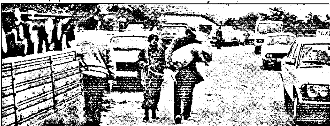
Cu porcul cumpărat n-ai decât două variante: ori îl duci cu... taxi, ori în brate. Unii au ales ultima variantă!