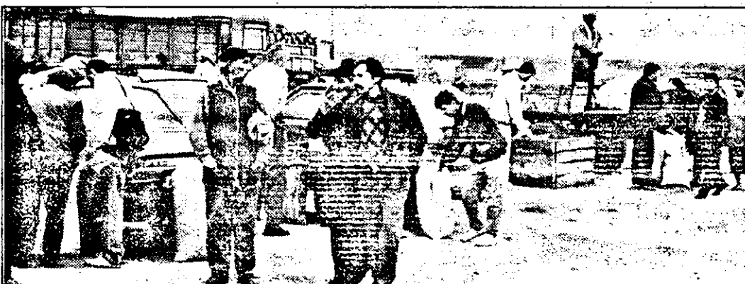
Printre fene, porumb, noroi și porci, agricultorii așteaptă cumpărători. Aceștia însă n-au cum ajunge la capătul lumii, acolo unde este piața de animale.

Mutată după bunul plac al unora, în detrimentul altora, piața de animale din cartierul Aradul Nou a ajuns în Sânicolaul Mic. Cu reale șanse de a ajunge la Fântânele sau poate la Zăbrani. Bătrânii care de zeci de ani știu bine locul unde e piața de animale din Aradul Nou rămân acum surprinși de faptul că aceasta a ajuns la capăt de oras, doar așa, pentru că vor unii.