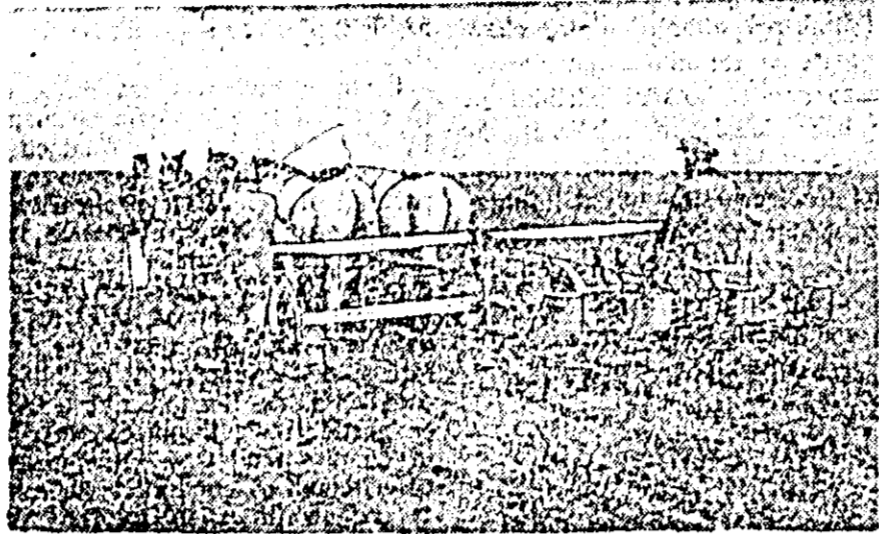
Însămînțînd în cuiburi așezate în pătrat cu noua semănătoare

Un ecou puternic a avut construcția pe țară a frunțășilor în agricultură în rîndurile colectivizărilor din comuna Șiria, raionul Arad.