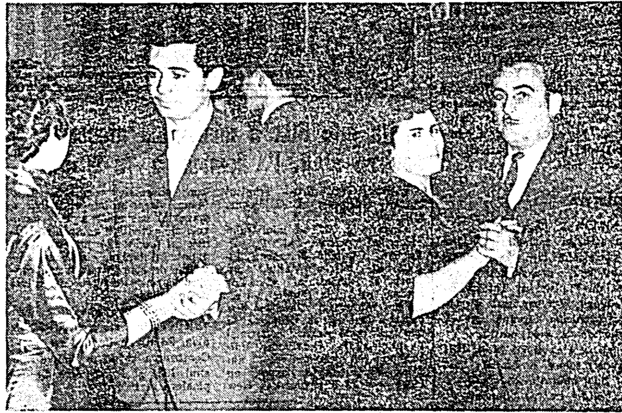
Dansul și voia bună l-a însoțit pe muncitorii fabricii „Tricolul roșu” în noaptea de revelion.

Fiecare aștepta ultima clipă a anului vechi și cea de început a anului nou. Iată-ne în preajma ultimelor minute ale vechiului an. Oamenii s-au strîns în jurul aparatelor de radio și al televizoarelor, pe al căror ecran apare figura alfit de cunoscută și iubită a tovarășului Gheorghe Gheorghiu-Dei. Cuvintele sale, adresate întregului popor, sînt ascultate cu inima plină de bucurie. Mesajul său s-a încheiat cu tradiționala urare „La mulți ani”. Arătătoarele ceasornicelor arată că au intrat în anul 1965. Acest lucru îl subliniază sunetul nenumăratelor sirene ale uzinelor. O mulțime de locatari au ieșit la geamuri și pe balcoane. Imbrățișări, strîngerii de mîni. Apoi, a început lărași petrecerea, care a continuat pînă în zori. Odată pe an se sărbătorește revelionul. GH. L.