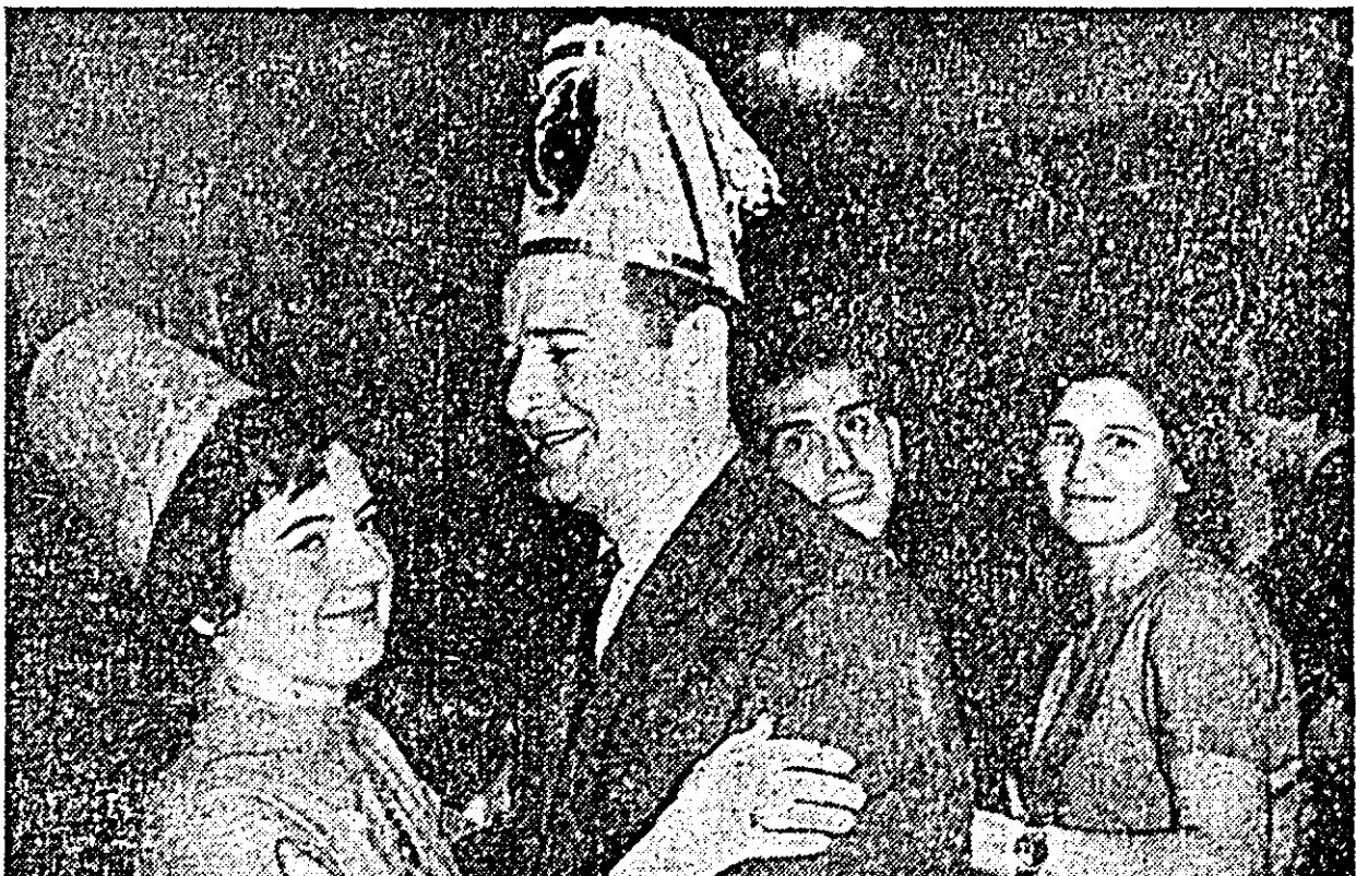
Dans și veselie la revelionul tineretului.

spune [ară, Să Inte- în ne insula 0 de și a și a amăc spune [ară, Să Inte- în ne insula 0 de și a și a amăc rintr-un de mare am spre și la ex- bel. În măz- lure de TEANU IV-a)