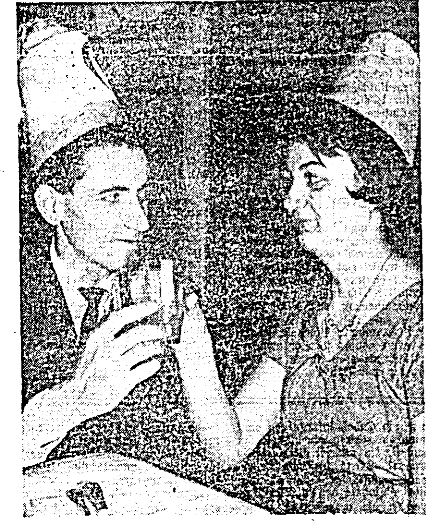
Un pahar pentru fericirea noului an.

Se ridică pahare, se fac urări de viitor. Oamenii sînt veseli, pornesc cu încredere în primele ore ale întinării anului 1965. Pînă în zori au sărbătorit mecanizatorii din Sîrbia noaptea de revelion. Clubul Școlii speciale din Sîrbia. În jurul bradului frumos împodobit, elevii așteaptă cu nerăbdare darurile lui Moș Gerilă. Cădrelor didactice au lăsat să asiste la acest moment solemn prezentîndu-se încă din vreme în sala care va găzdui revelionul. Se impart darurile pentru cei rămași în cadrul școlii în timpul vacanței. Apoi, colectivul școlii începe micile pregătiri pentru noaptea de revelion. Se reglează televizoarele, se aleg plăcile, se pregătesc mesele cu bucate. Se toastează pentru noi succese în lumea didactică. La Școala de 8 ani din Sîrbia numeroși învățători și profesori au sărbătorit împreună noaptea de revelion. Într-o atmosferă de veselie și voie bună, tinerii și vîrstnicii au petrecut ultima noapte a anului 1964. M. M.