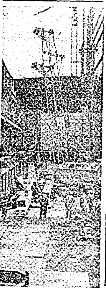
Imagineri de pe șantierul Centralei electrice de termoficare pe lignit Arad.