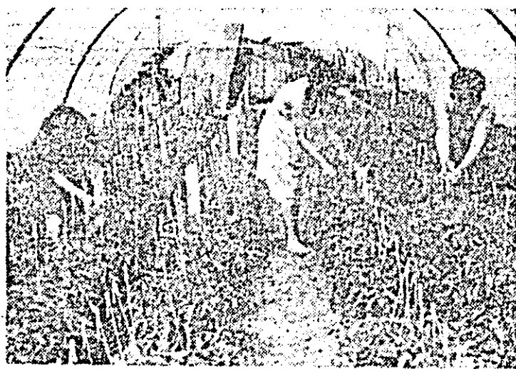
Activitate spornică la lucrările de sezon în solarile Stațiunii de cercetare și producție legumicolă Aradul Nou.