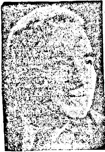
Tov. VASILE LUCA

Printr-un decret al Prezidiului Mare Adunării Naționale a RPR tov.