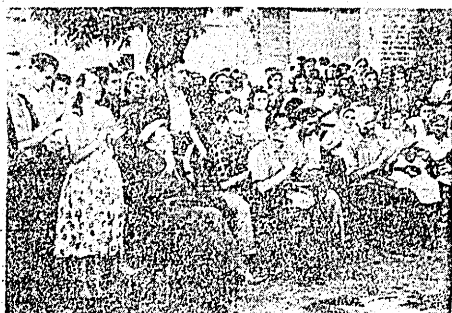
Printre mîile de oameni ai muncii care au protestat împotriva sentinței ilegale a tribunalului de la Karlsruhe, prin care s-a interzis activitatea Partidului Comunist din Germania, se numără și colectivele de muncă de la cooperativa „Solidaritatea țîmpărilor” și de la fabrica „Tricoul roșu”.

În clișee: (stînga) mitingul de la „Solidaritatea țîmpărilor”; (dreapta) aspect de la mitingul colectivului de la „Tricoul roșu”.