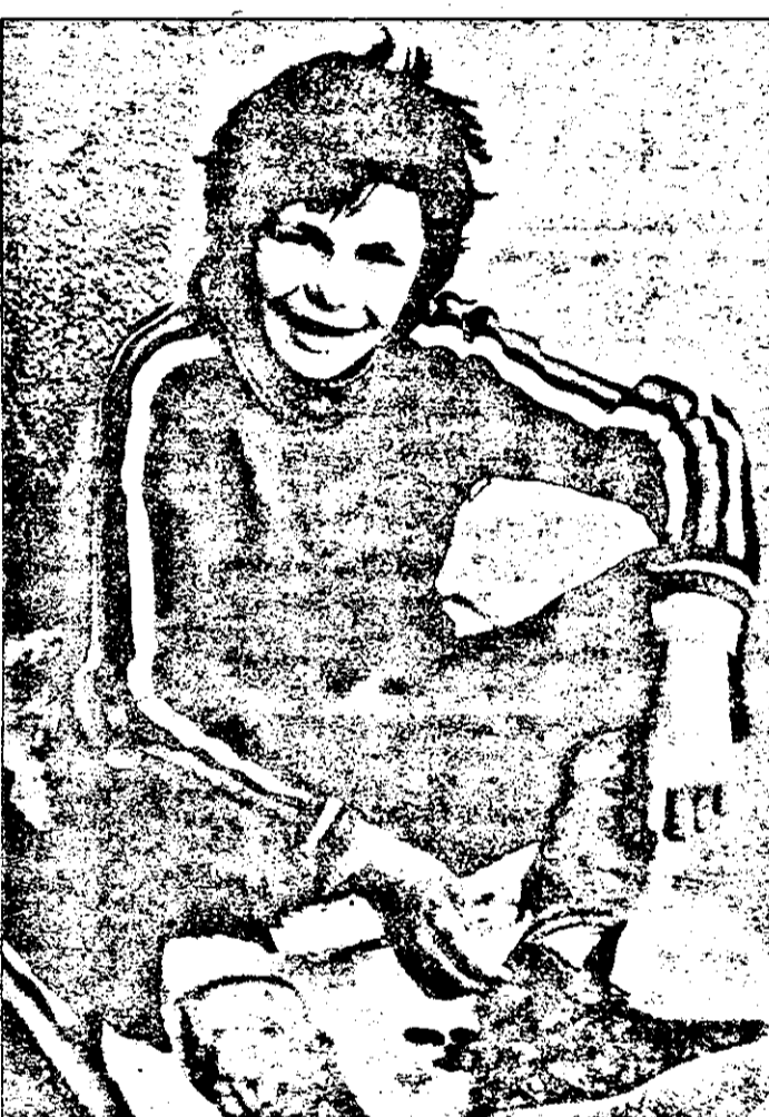
Oameni fiind, cerșetorii zâmbesc și ei, chiar dacă pentru 50 de lei.

A început acțiunea de reînnoire a abonamentelor la ziarul „Adevărul”. Costul unui abonament pe luna mai este de 2600 lei - ceea ce înseamnă că fiecare număr de ziar vă revine cu circa 100 de lei și economisiți lunar 1250 lei. Așadar, asigurați-vă din timp abonamentul și, prin el, ziarul nostru, un ziar care nu trebuie să lipsească din nici un cămin - fiindcă prin intermediul „Adevărului” veți lua zilnic pulsul vieții și al evenimentelor din județ, din țară, din lumea întreagă. ADEVĂRUL