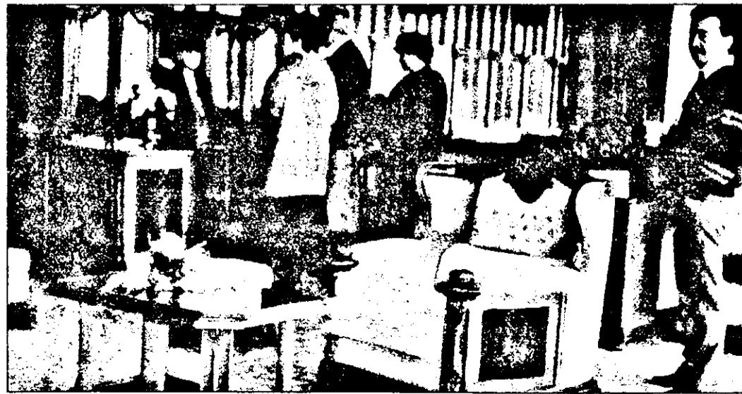
Eleganță, bun gust, rafinament. Într-un cuvânt mobilă de lux.