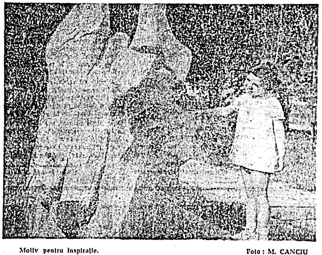
Motiv pentru inspirație.

ASTRE Sînt un țrabădur Din lumea celor mulți. Om comun. Cum e vremea obișnuită, Cînd din castan Cad ultimele toade Mal coapte decît o ținimă țarnă. Rodul din arborii aceștia Răspund chemății pămîntului Cînd singur țice țunze. Așteaptă ultima mlîngiere a vîntului Tomnatec de seară. Din cîlimara mea, Curge țlavă sultetească, Eu ascult țrosnetul castanelor Căzînd în pămîntul, Cu ținimă țlavă de lumini De unde țțineșe țivoare Spre lumea astrelor albe. Sînt un țrabădur Din lumea celor mulți Cum e vremea obișnuită TEODOR FRÎNCU