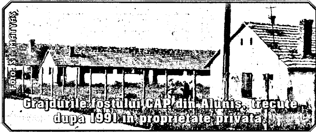
Grajdurile fostului CAP din Aluniș, trecute după 1991 în proprietate privată.

În 1991, după desființarea CAP, la Aluniș a luat ființă societatea agricolă „1 Decembrie”, având o suprafață de circa 300 ha și 200 de asociați. Patrimoniul preluat de la CAP însuma grajduri, magazii,