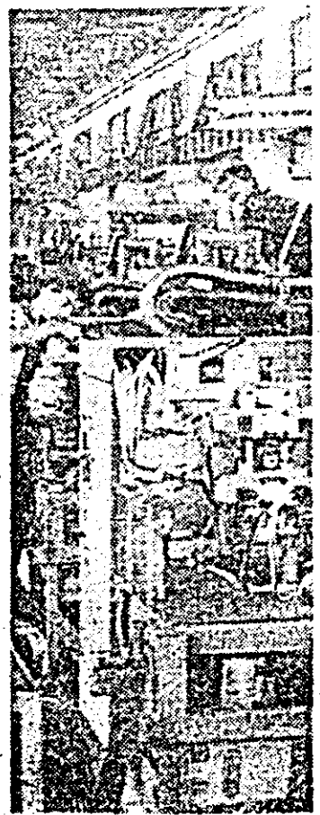
Întreprinderea de mașin-unelte. Aspert din secția mașinilor la temă.

Revista presel literare • Copiii cină patria și partidul • Acțiuni cinematografice • Sport • Programul instituțiilor culturale