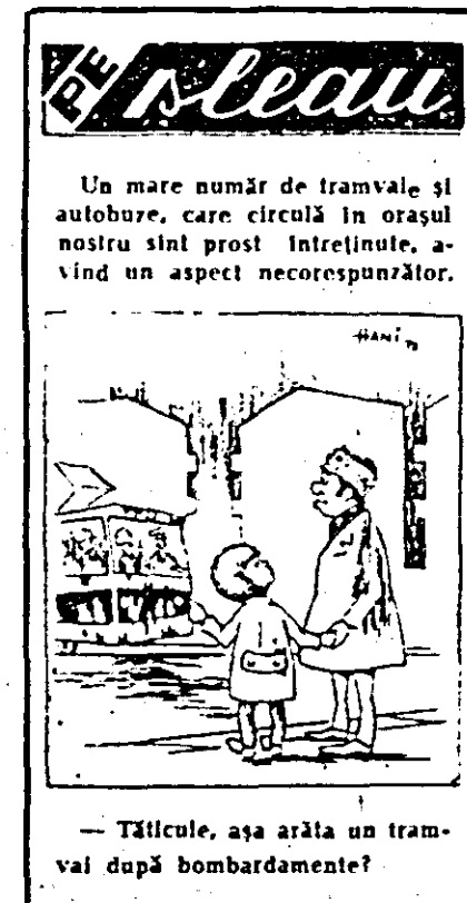
— Tâlcule, așa arăta un tramvai după bombardamente?

rosabile și unul din jucătorii s-ar fi repetat să o repună în joc și dacă în momentul acela ar fi trecut pe acolo un autobuz, un camion sau o simplă motocicletă? Din carambolul acesta posibil între tehnică și om, este clar că cine ar fi rămas deteriorat; trupul ar fi plătit gestul imprudent cu o gravă întîmplată sau chiar cu viața.